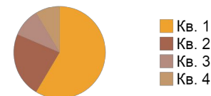
Рисунок 6. Название иллюстрации [4, с.17].