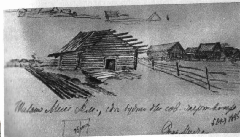
Шалаш, где якобы совершено было жертвоприношение.