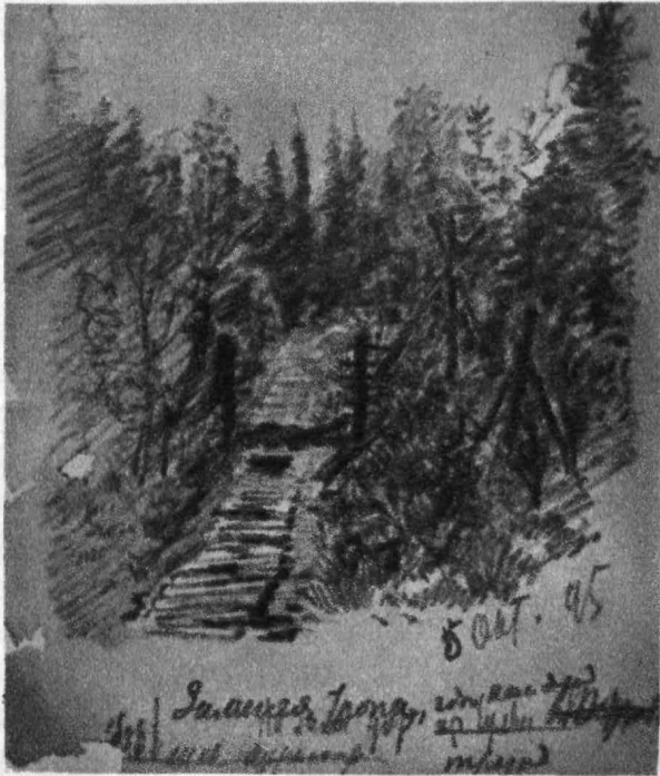
Тропа, на которой был найден труп нищего Матюшина Рис. В. Г. Короленко, 1895 г.