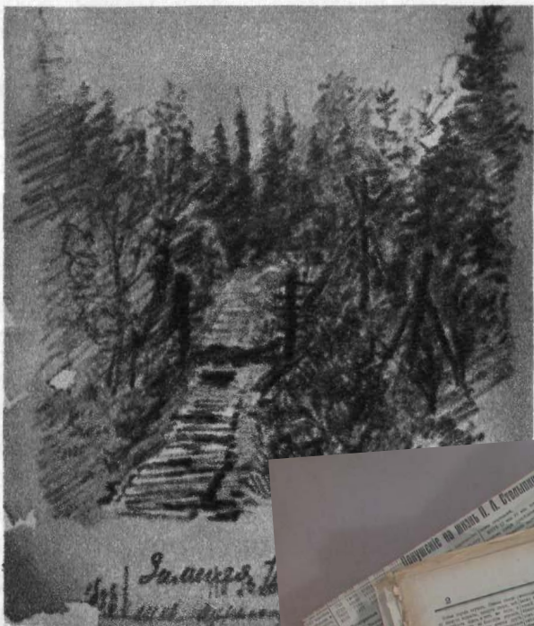
Тропа, на которой был найде