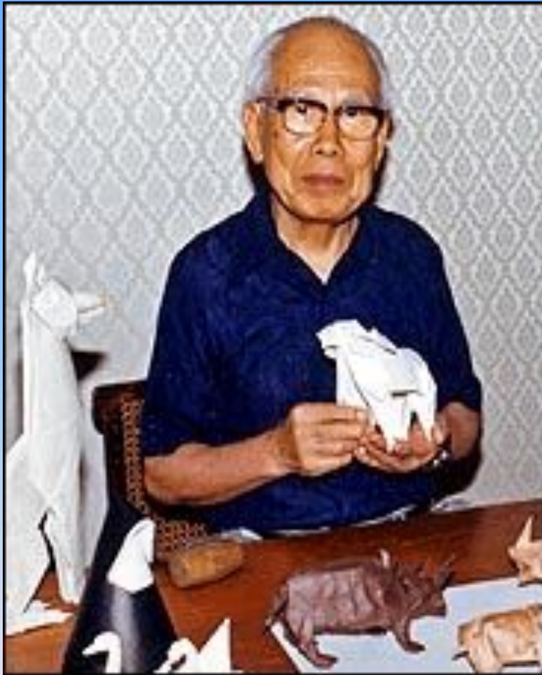
сенсей Акира Йошизава

Появление большого числа авторских работ связано с именем знаменитого японского мастера Акиры Йошизавы. Именно он придумал "нотную азбуку" оригами, которая позволила записывать и передавать процесс складывания фигурок.