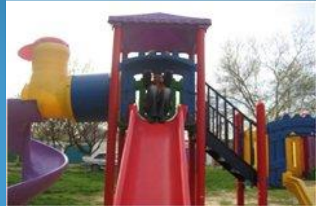
верх - низ