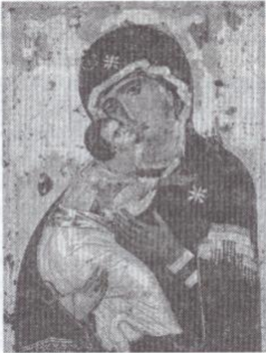
Ікона Вишгородської Богоматері

Великого значення в зображеннях на іконах надавалося кольорам. Так, золотистий і жовтий символізували небесне царство, білий – перетворення небесного на землі, блакитний – небо, зелений – усе земне, різні відтінки червоного – царське, божественне походження й виявлення ласки божої.