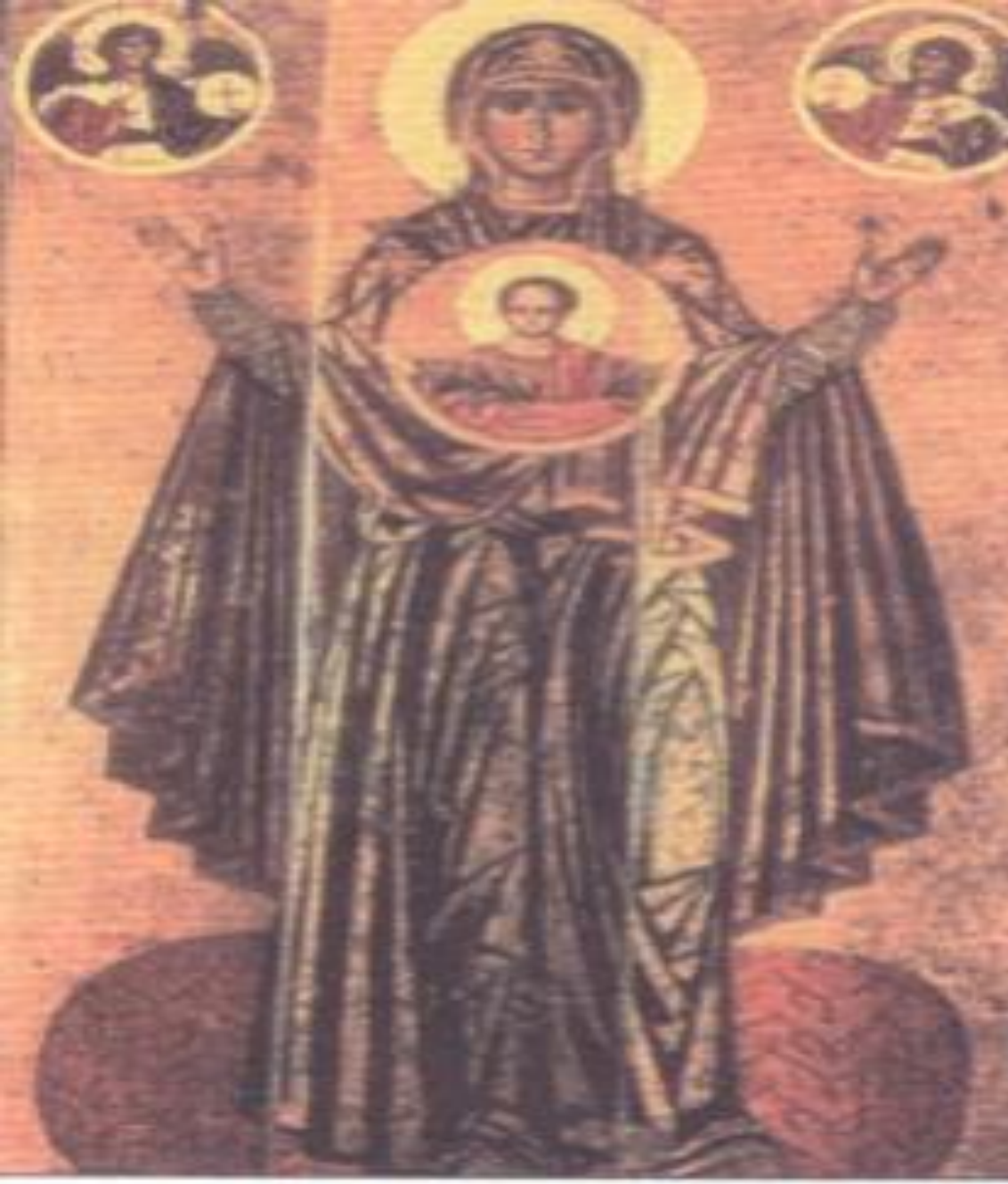
Ікона „Знаменна” (Велика Панагія XII ст.