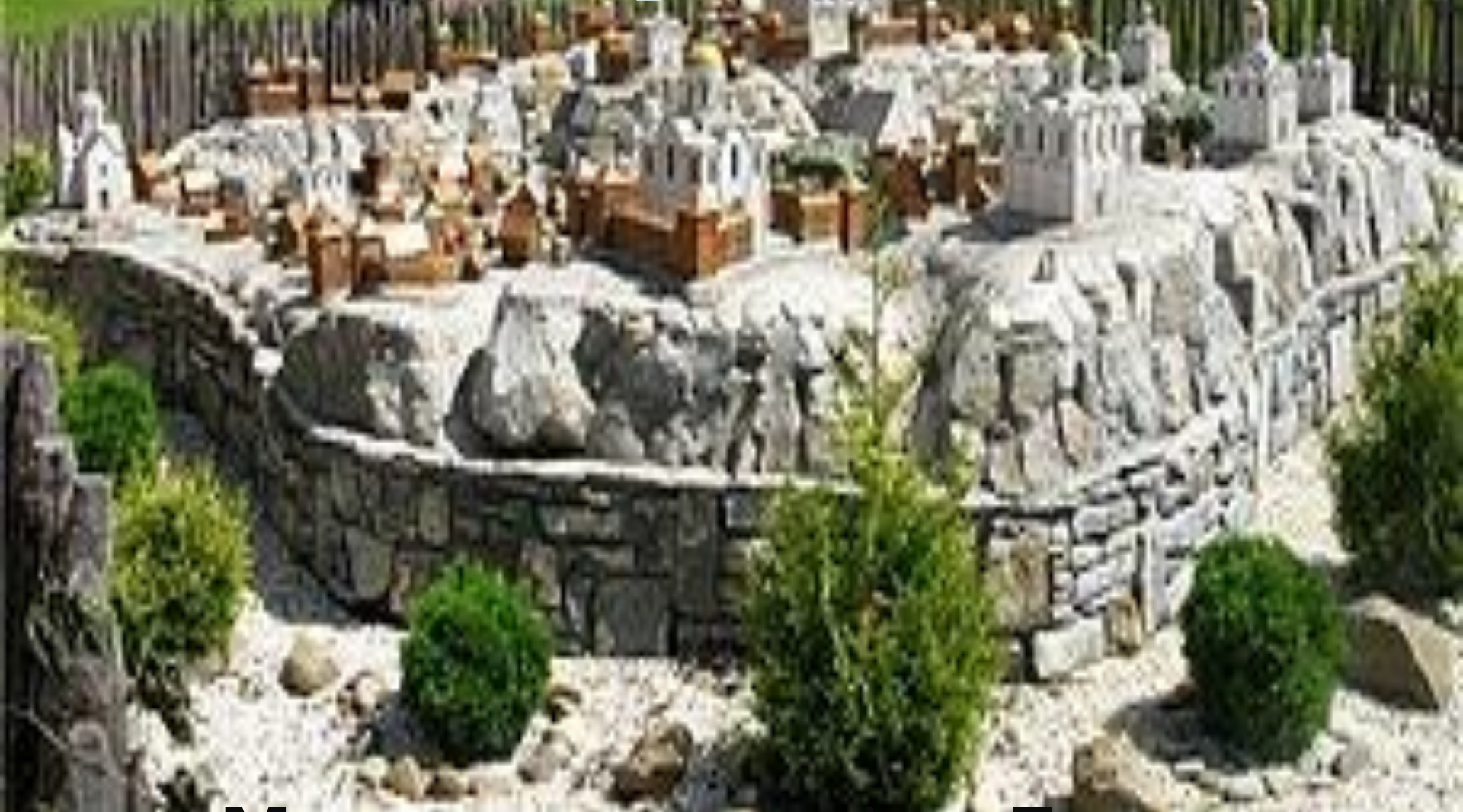
Макет давнього міста Галич