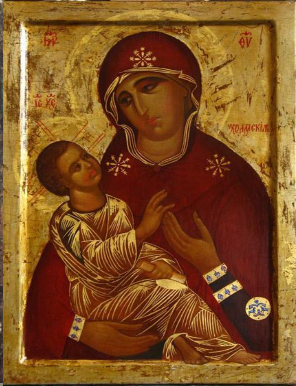
Холмська ікона Богородиці