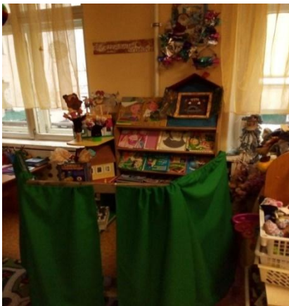
День добрых дел