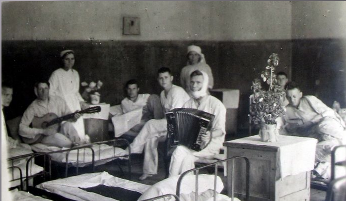
Эвакгоспиталь. В палате у больных.

Не смотря ни на какие трудности бойцы не унывали, всегда находили место для шуток, подбадривали друг друга.