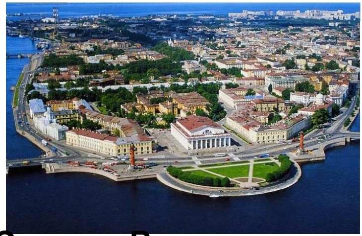
Стрелка Васильевского острова