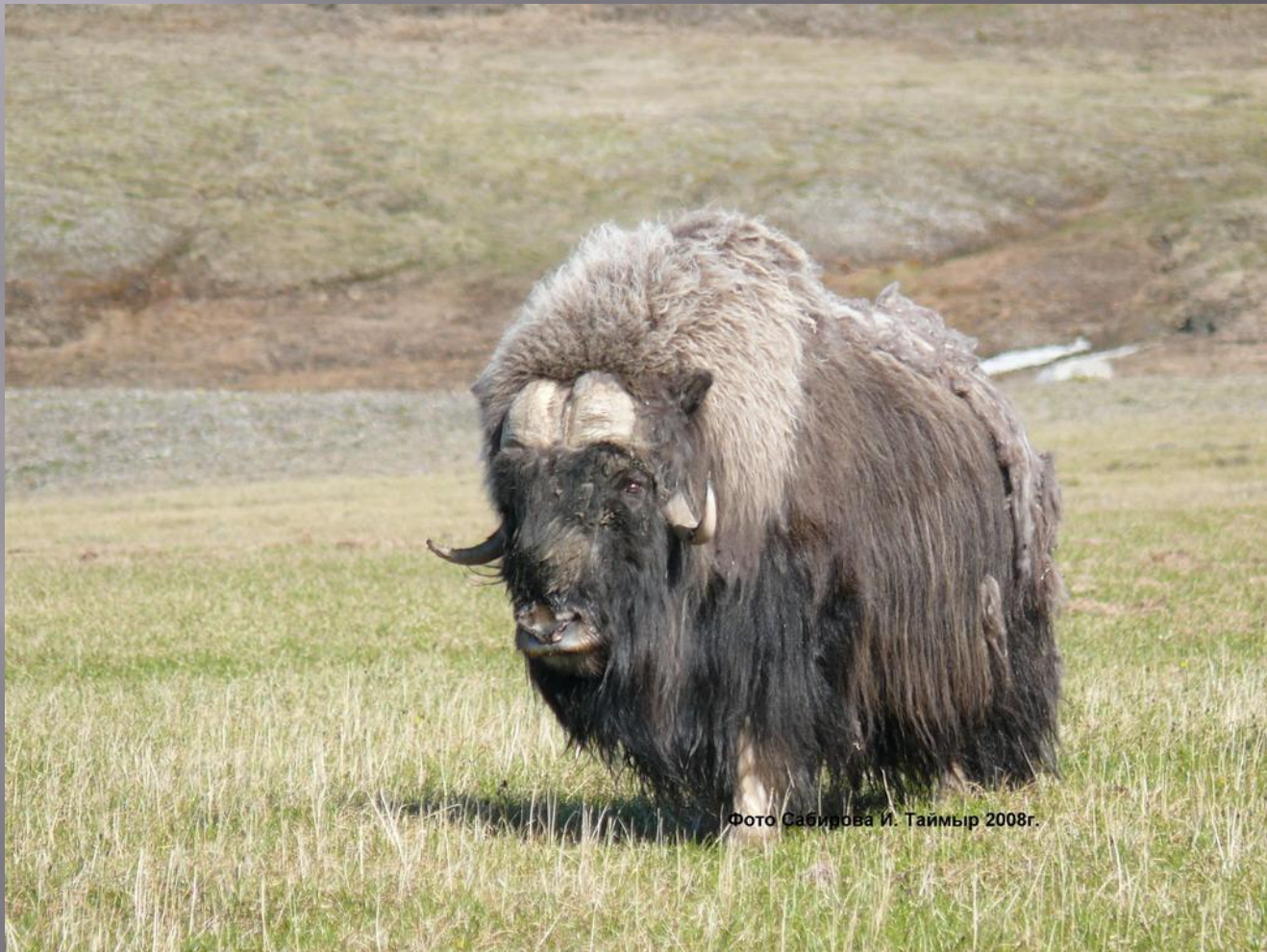
Таймыр 2008г.