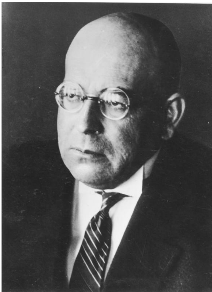
Bundesarchiv, Bild 183-R00610 Foto: o. Ang. / o. Dat.