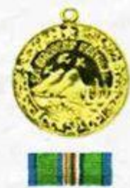
«За оборону Кавказа»