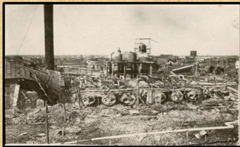
Завод им. Седина в г. Краснодаре после оккупации