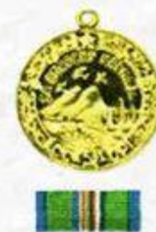
«За оборону Кавказа»