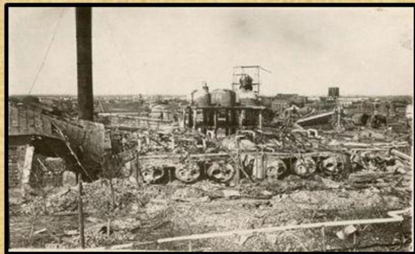
Завод им. Седина в г. Краснодаре после оккупации