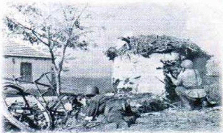
Атака. Кубань, 1943 г.

К июлю 1942 г., когда война пришла на землю Кубани, каждый пятый житель края ушел на фронт. Из добровольцев было создано более 90 истребительных батальонов и три казачьих соединения — 50-я отдельная кавалерийская дивизия, 4-й Кубанский гвардейский кавалерийский корпус и Краснодарская пластунская дивизия. Уходящим на фронт давали наказ: «Снова вы взяли в руки клинки и сели на боевых коней, чтобы, как и в прежние годы, отстоять нашу землю, нашу Родину от врага. Мы верим вам и гордимся вами — вы свято выполните принятую вами воинскую присягу и возвратитесь в родные станицы только с победой... А если придется кому из вас отдать жизнь за родную землю, отдайте ее как герои...»