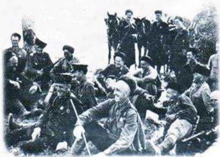
Бойцы 4-го Кубанского гвардейского кавалерийского корпуса на привале. 1942 г.