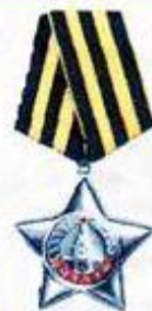
Орден Славы III степени