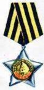
Орден Славы II степени