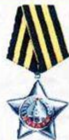
Орден Славы III степени