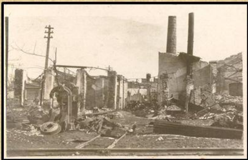
После оккупации. Нефтеперегонный завод в г. Краснодаре