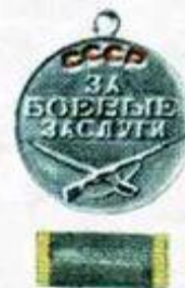
«За боевые заслуги»