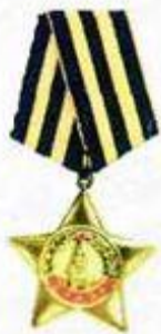
Орден Славы I степени