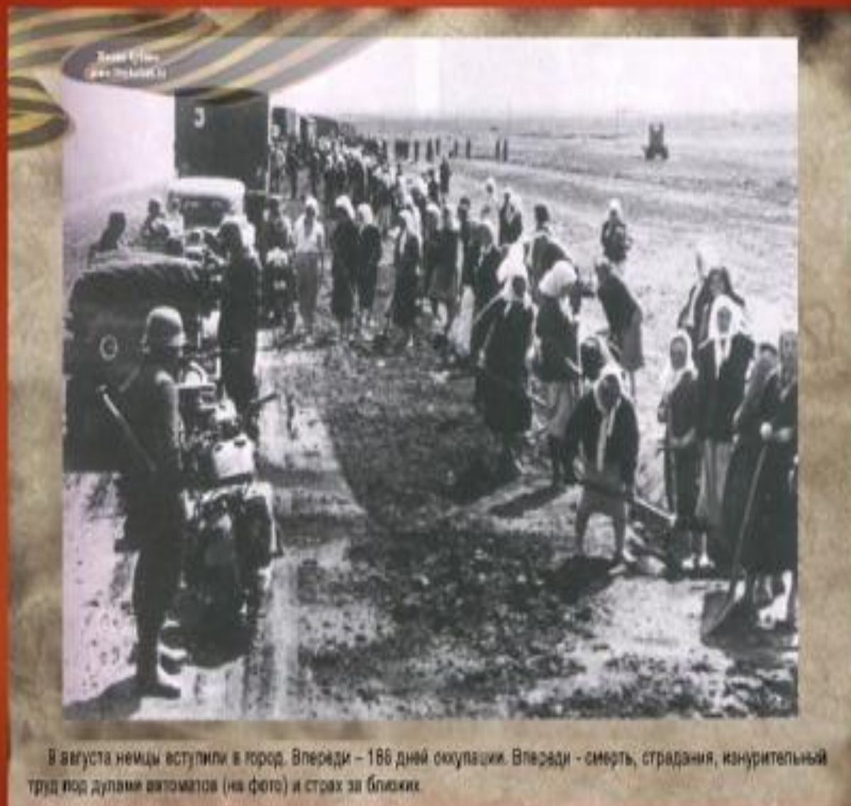
9 августа немцы вступили в город. Впереди – 186 дней оккупации. Вспереди - смерть, страдания, изнурительный труд под дулами автоматов (на фото) и страх за близких.