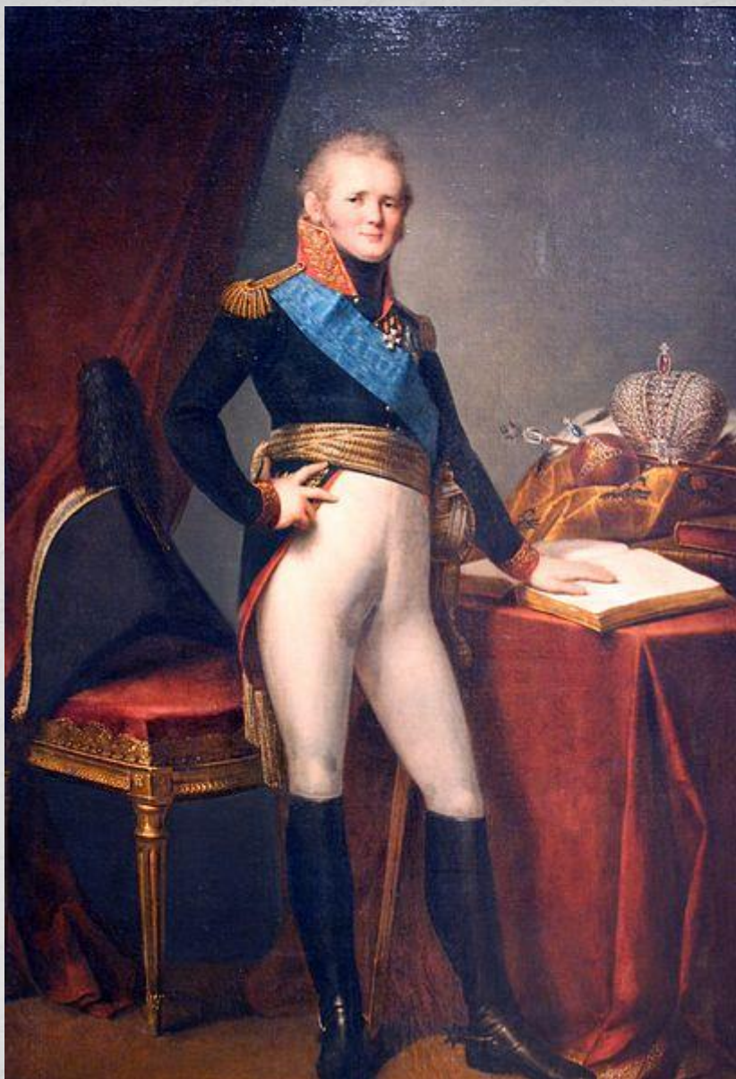
Российский император Александр I