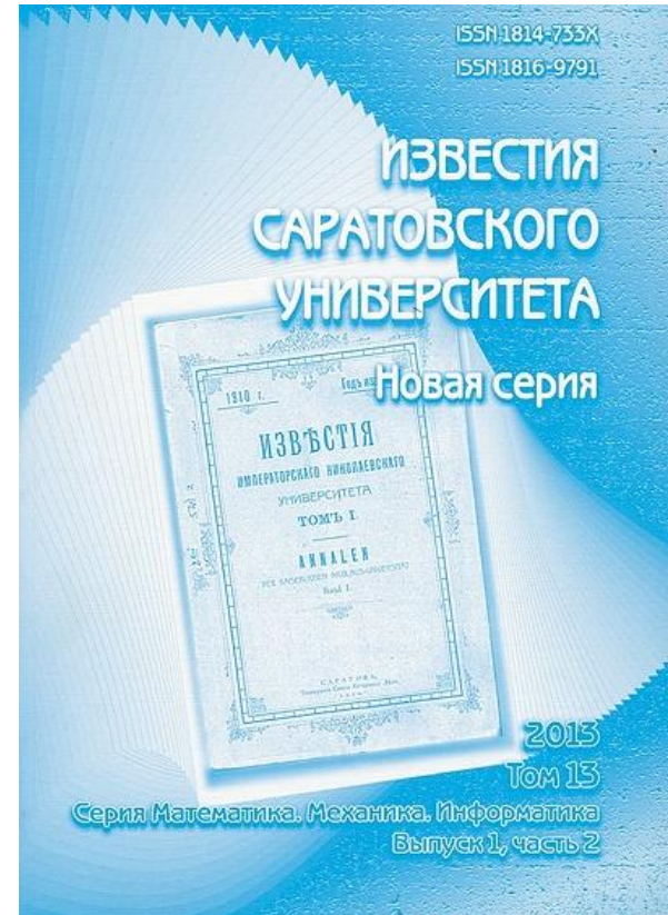
Известия саратовского университета. Новая серия: Математика. Механика

В статье С.С. Волосивец «Абсолютная сходимость простых и двойных рядов Фурье по мультипликативным системам» Устанавливаются двумерные аналоги известных условий Зигмунда и Саса для абсолютной сходимости рядов Фурье – Виленкина. Также доказывается, что двумерное условие Саса является не улучшаемым в определенном смысле.