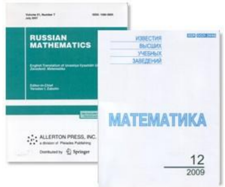
Известия высших учебных заведений. Математика.

В статье С.А. Теляковского «К вопросу о характере сходимости рядов Фурье функций ограниченной вариации» изучаются возрастающие последовательности натуральных чисел, разбивающие ряды Фурье функций ограниченной вариации на пачки, ряды из которых абсолютно сходятся. Получен новый вариант теоремы об устойчивости таких последовательностей.