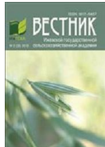
Вестник Ижевской сельскохозяйственной академии