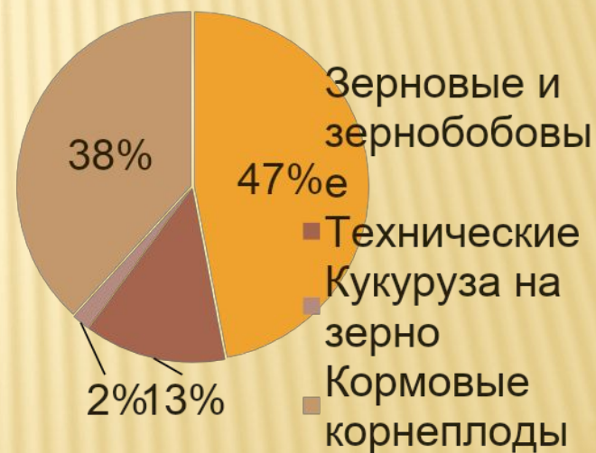
Структура посевных площадей, %