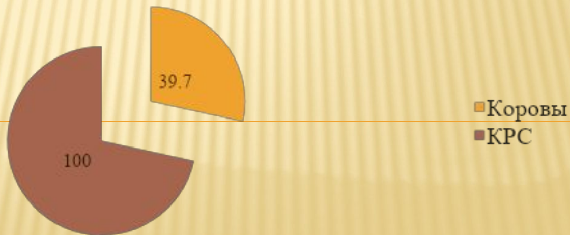
Структура стада, 2013 г.