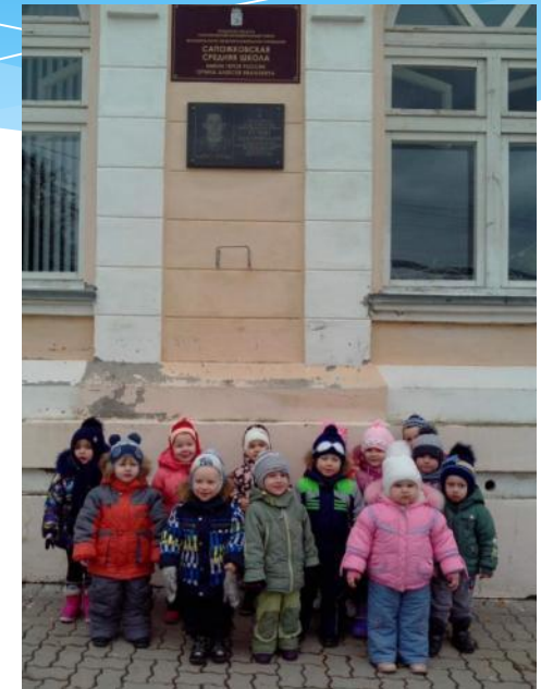
Школа героя России