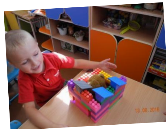
Теремок, теремок! Он не низок, не высок!