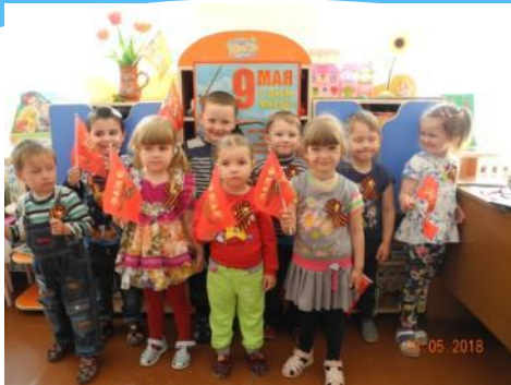
Мы помним подвиг прадедов!