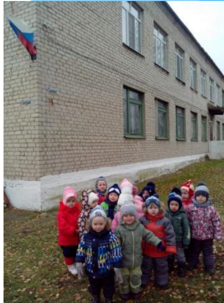
Лучше сада не найти!