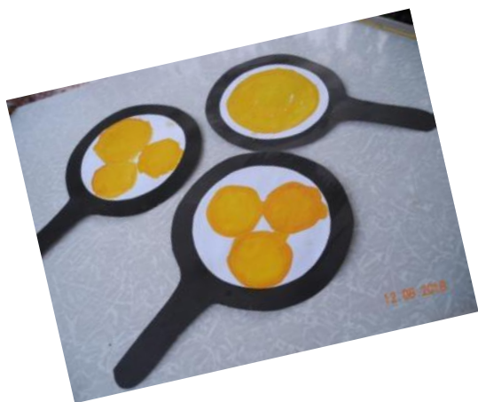
Ладушки-ладушки, Испекли оладушки

Как на птичьем на дворе Ходят куры по траве. Зерна, крошечки клюют И цыплят к себе зовут.