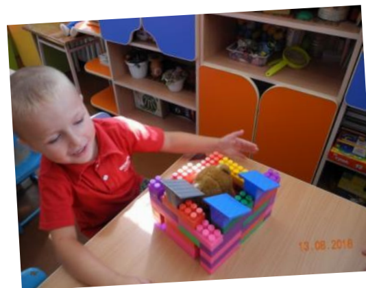
Теремок, теремок! Он не низок, не высок!