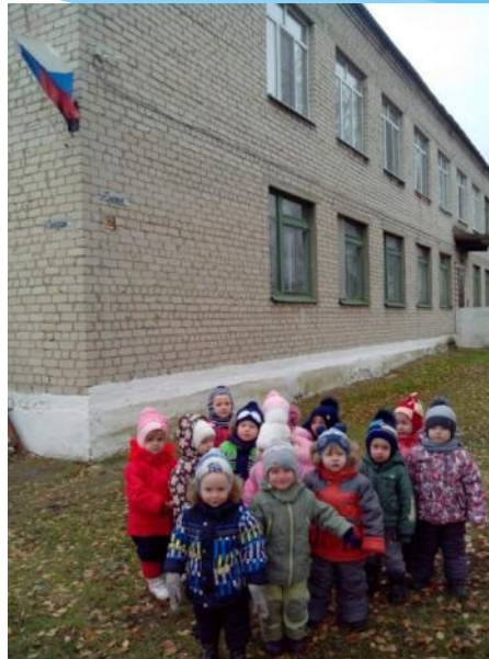
Лучше сада не найти!