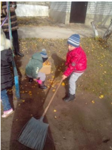
Сделаем чистым наш двор!!!