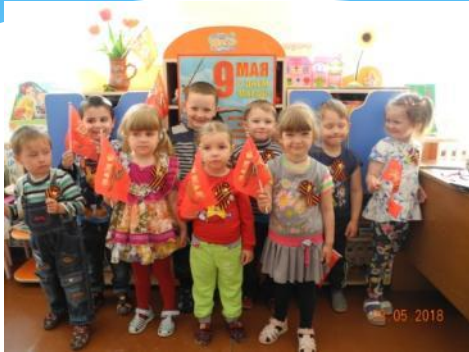
Мы помним подвиг прадедов!