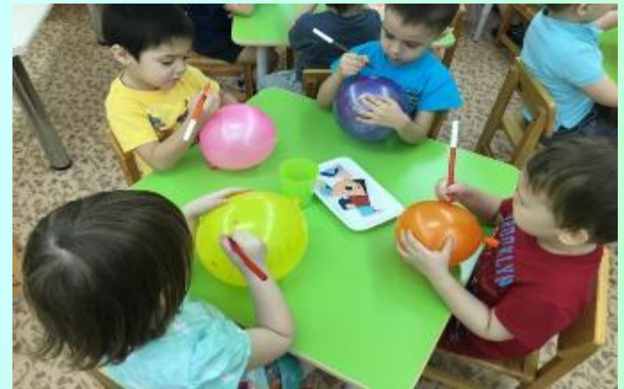
Рисуем девочек и мальчиков