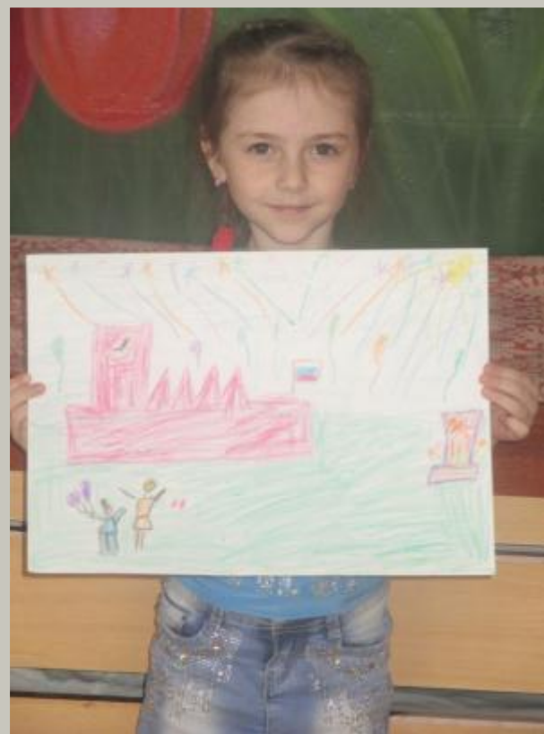
Муниципальный и Региональный уровень «Весна Победы»