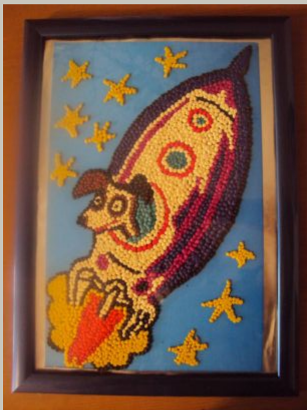
Уровень ДОУ «На ракете к звёздам»