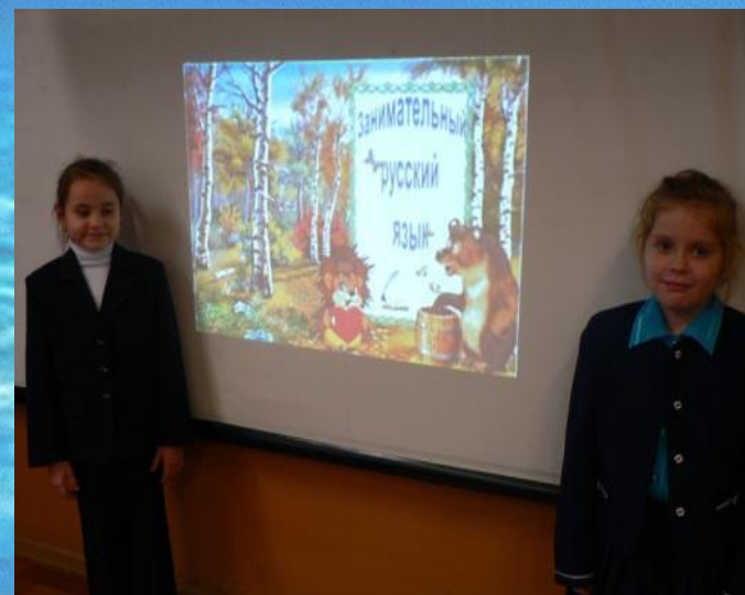
Ученицы 1 «а» класса.