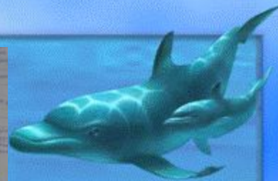
Стенгазета 4 «а» класса.