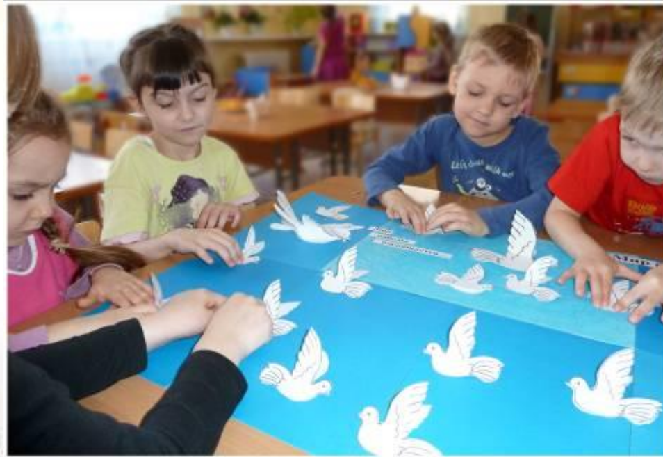
«Мир без войны» (коллективная композиция)