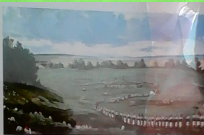
Юрши дэуш-ан о мордовским обряд