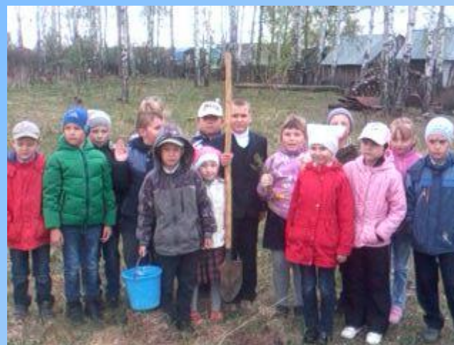
Проект « Посади дерево»