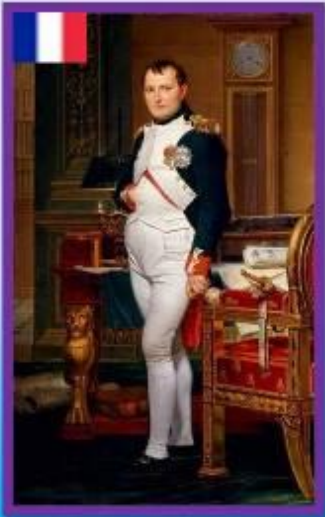
Наполеон I Бонапарт.