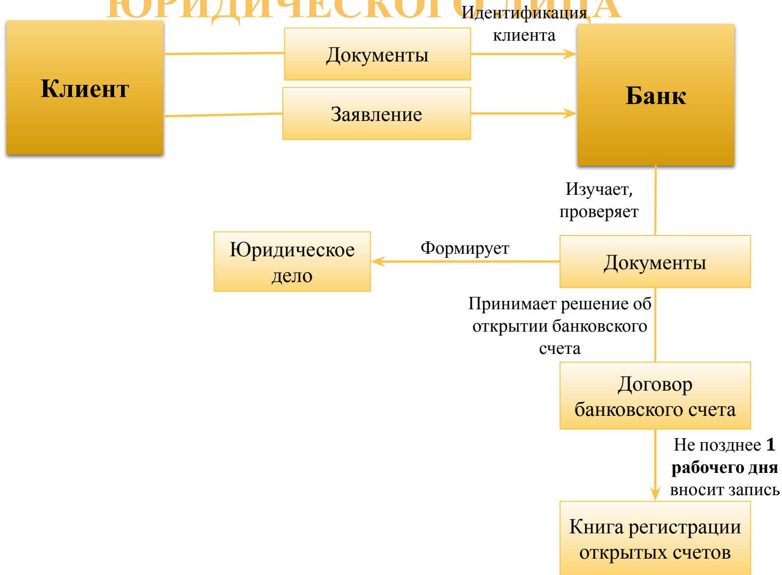
СХЕМА ОТКРЫТИЯ ВАЛЮТНОГО СЧЁТА ЮРИДИЧЕСКОГО ЛИЦА