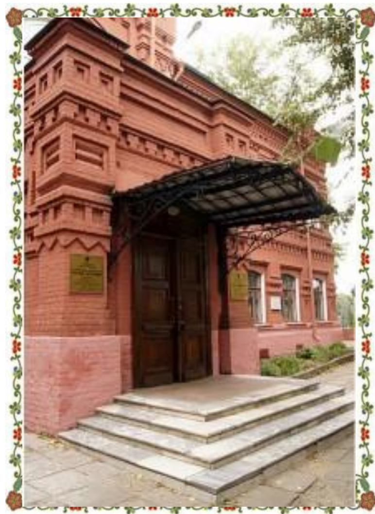
Первые матрёшки. Музей игрушки, Сергиев-Посад