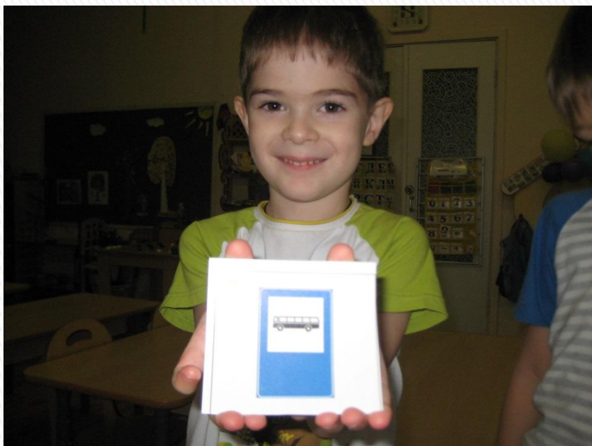
Место остановки автобуса