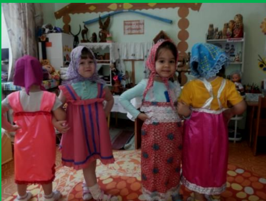
Танец «Мы весёлые Матрёшки»