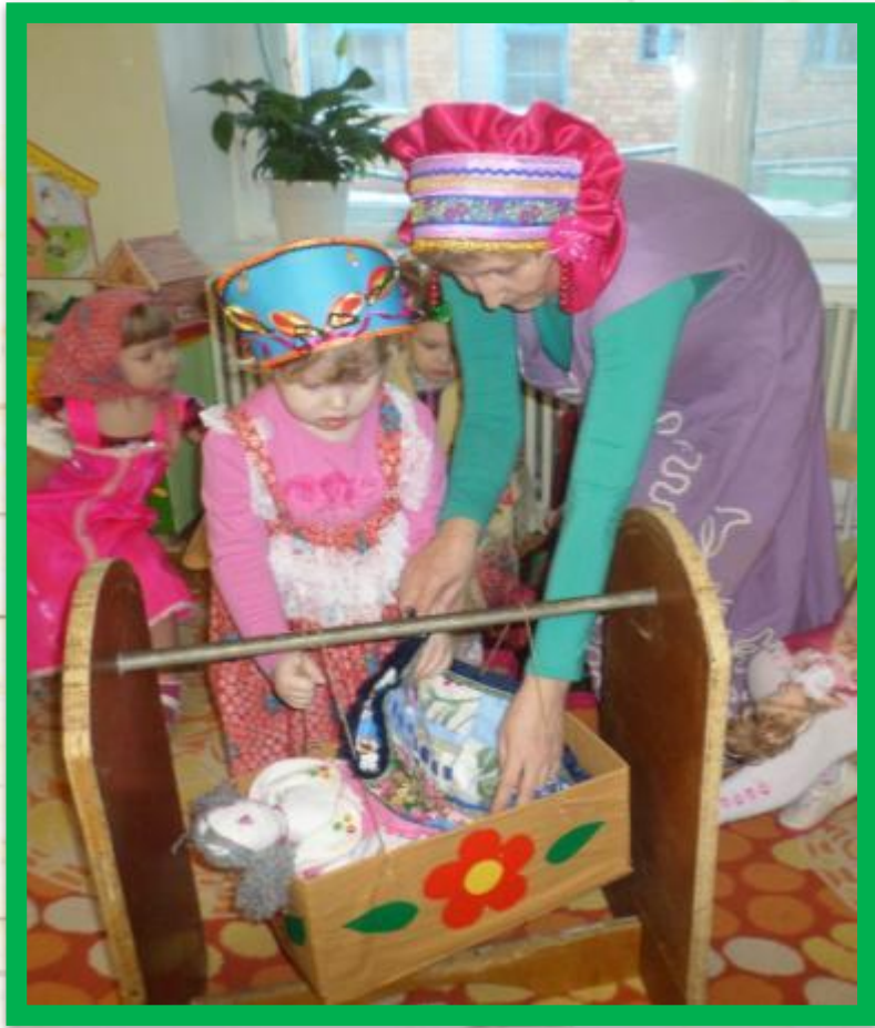
Сюжетно ролевая игра «Уложим куклу спать»