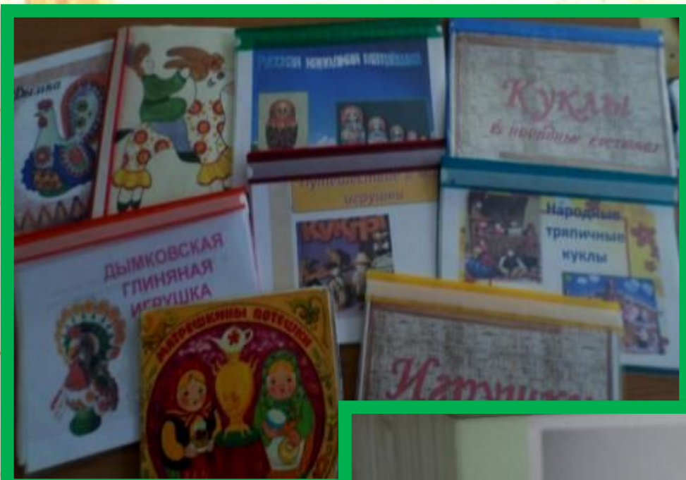
Выставка в мини – музее «Горница»