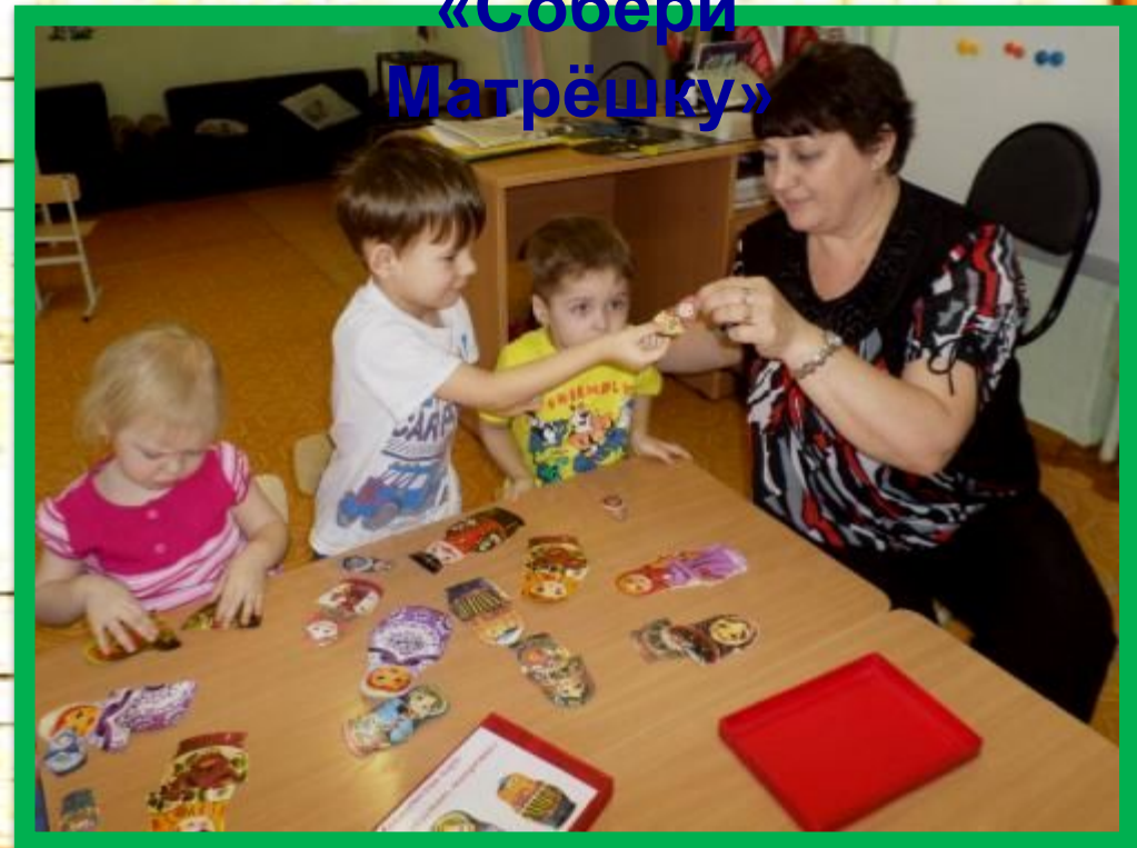
Дидактическая игра «Собери Матрёшку»