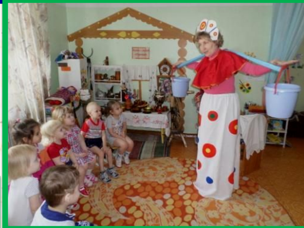
Экскурсия «Знакомство с барышней «Водоноска»