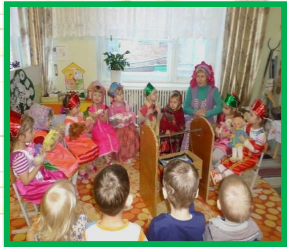
Обыгрывание колыбельной «Баю - баюшки баю»