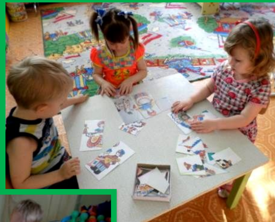
Настольная игра разрезные картинки «Собери Дымку»