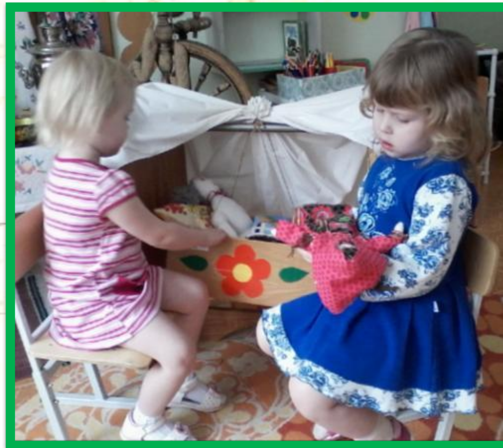
Сюжетно ролевая игра «Дочки – матери»