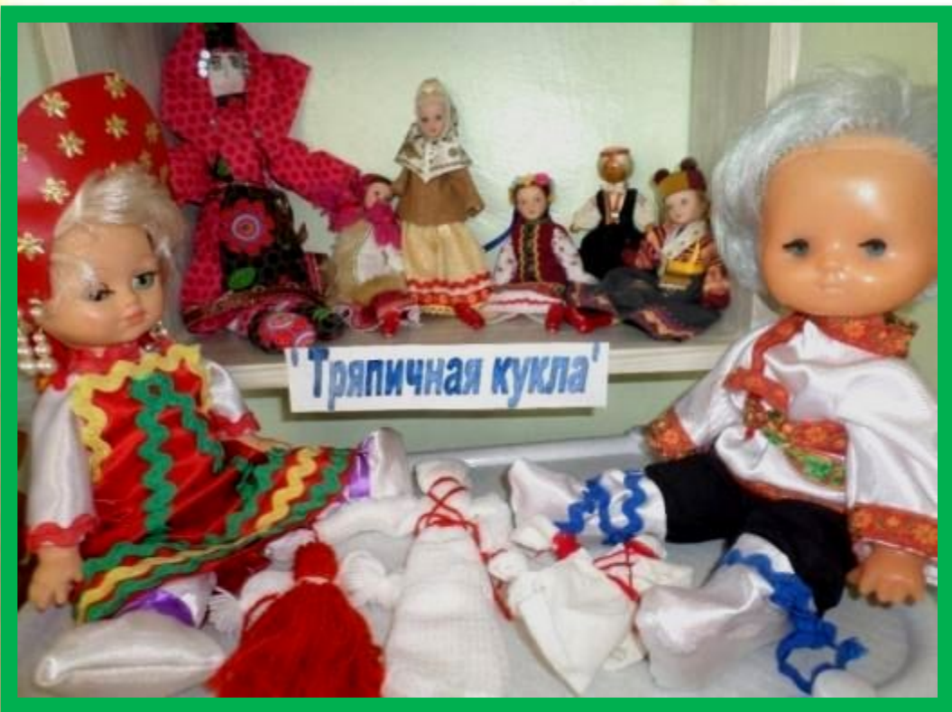
Выставка в мини - музее «Тряпичные куклы»