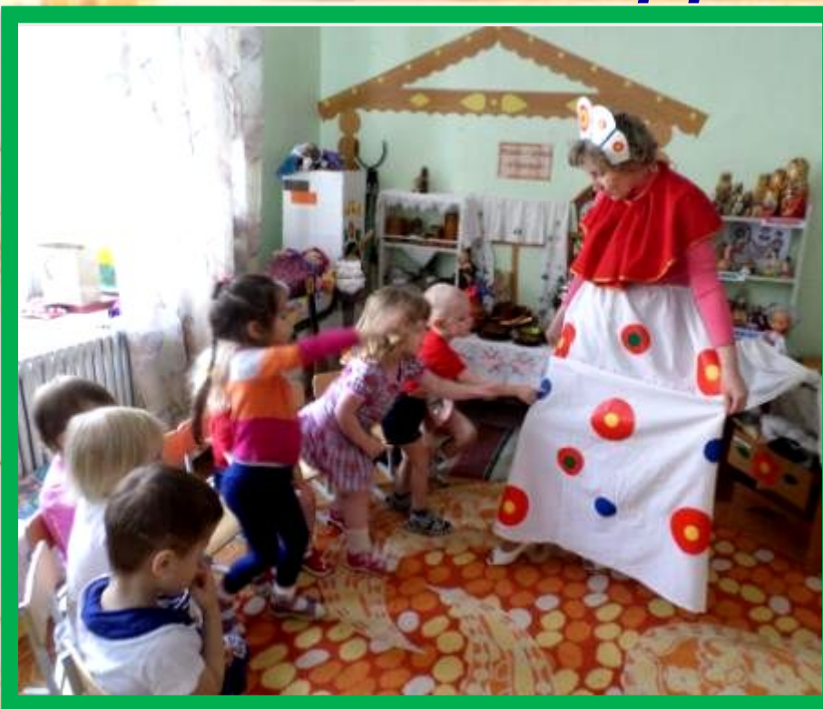
Подвижная игра «Нянька»