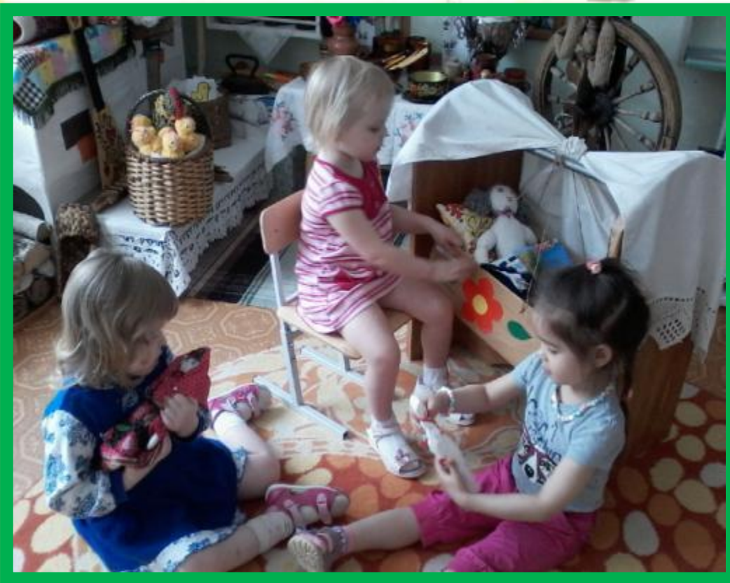
«Самостоятельная игровая деятельность»