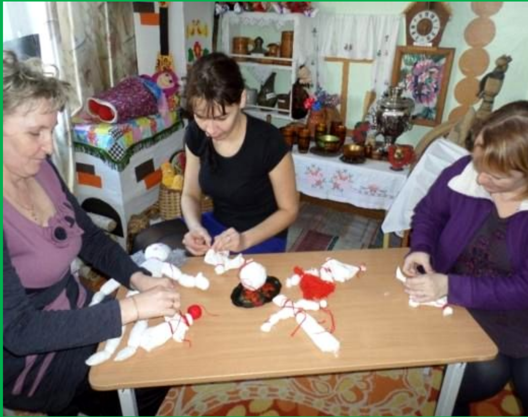
Мастер – класс для родителей «Кукла – оберег»