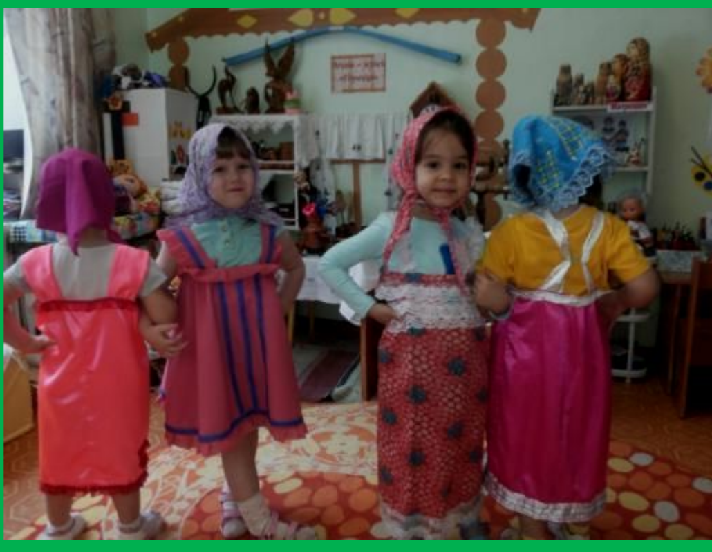
Танец «Мы весёлые Матрёшки»