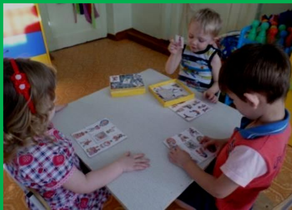
Дидактическая игра - лото «Дымковское