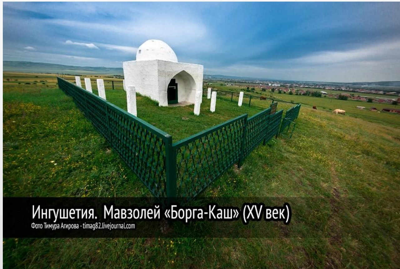
Ингушетия. Мавзолей «Борга-Каш» (XV век)