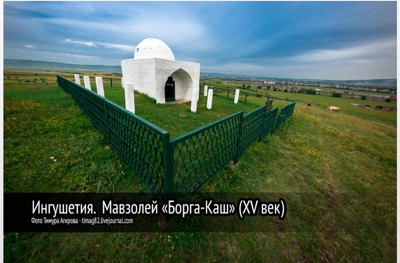
Ингушетия. Мавзолей «Борга-Каш» (XV век)