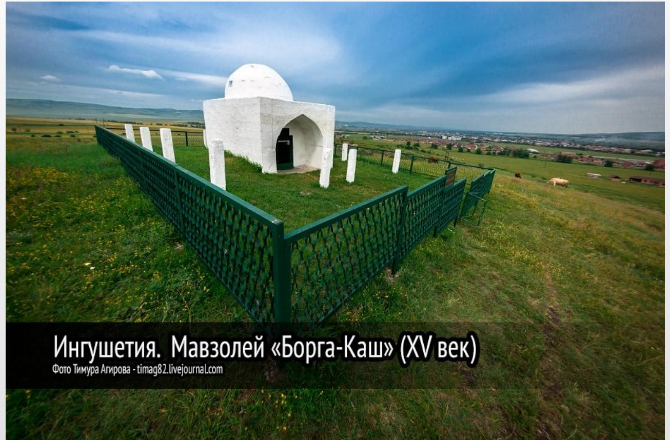
Ингушетия. Мавзолей «Борга-Каш» (XV век)