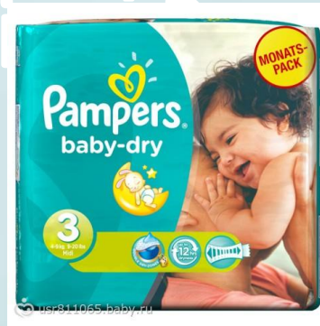
Pampers New Baby-Dray