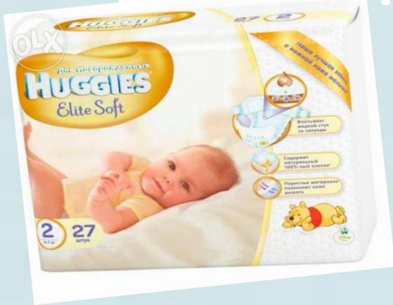
Huggies Elite Soft