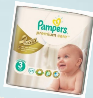
Pampers Premium Care