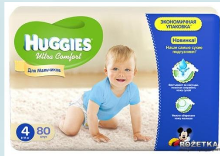
Huggies Ultra Comfort