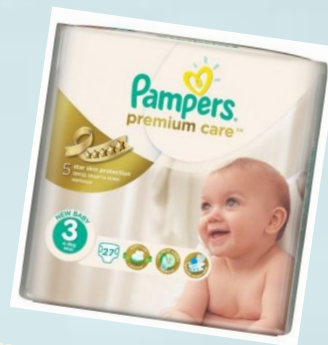
Pampers Premium Care