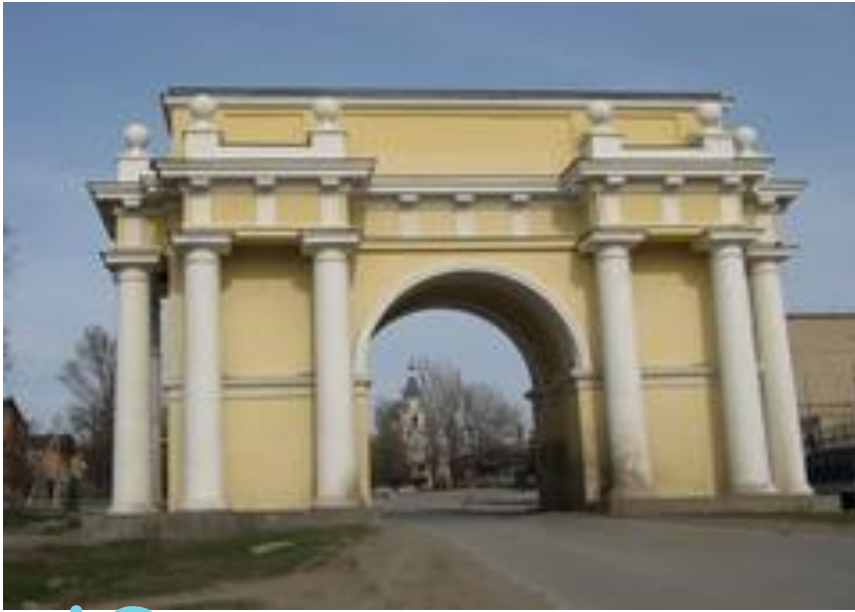
Юга - западная