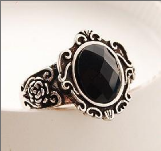
Ретро кольцо, 16 размер