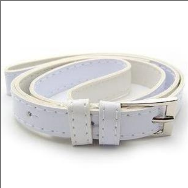
Лаковый ремень, белого цвета