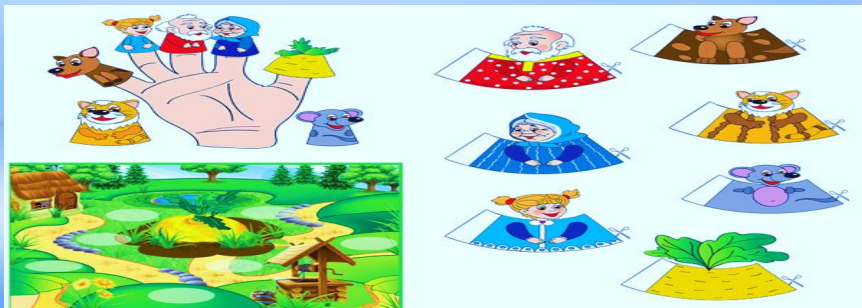
Пальчиковый театр по сказке «Репка»

-Проводите занятия весело, «не замечайте», если малыш на первых порах делает что-то не правильно, поощряйте успехи, говорите ободряющие слова.