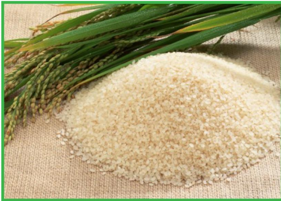
Рис в США капиталоемкий, так как он выращен с применением передовой дорогой техники, а во Вьетнаме рис трудоемкий, в его производстве применяется в основном ручной труд.