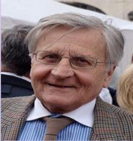
Жан-Клод Трише (1985-1993)