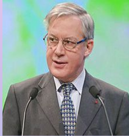
Кристиан Нойер (1993-1997)