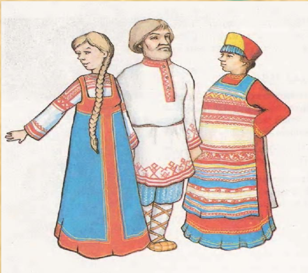
Русский национальный костюм