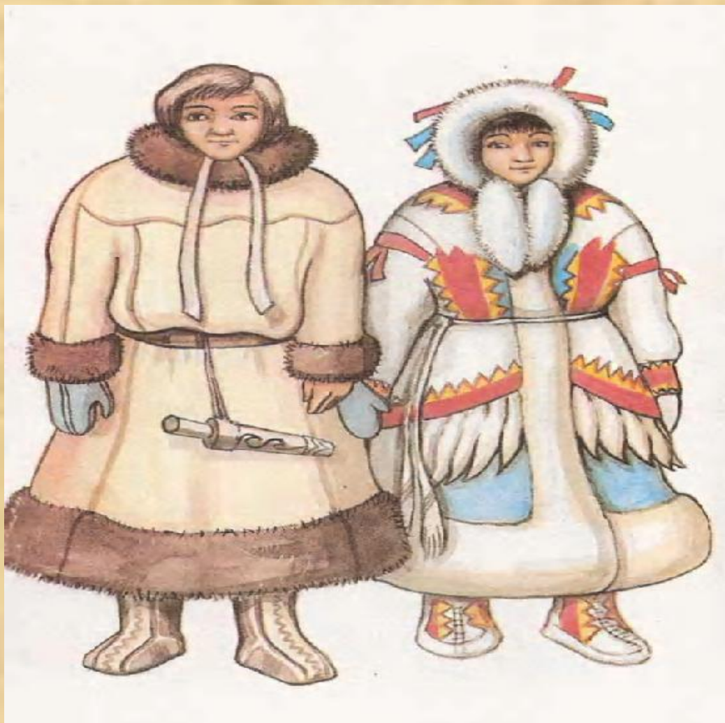
Ненецкий национальный костюм