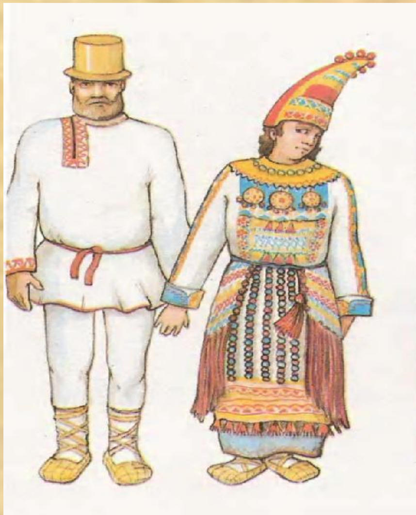
Мордовский национальный костюм