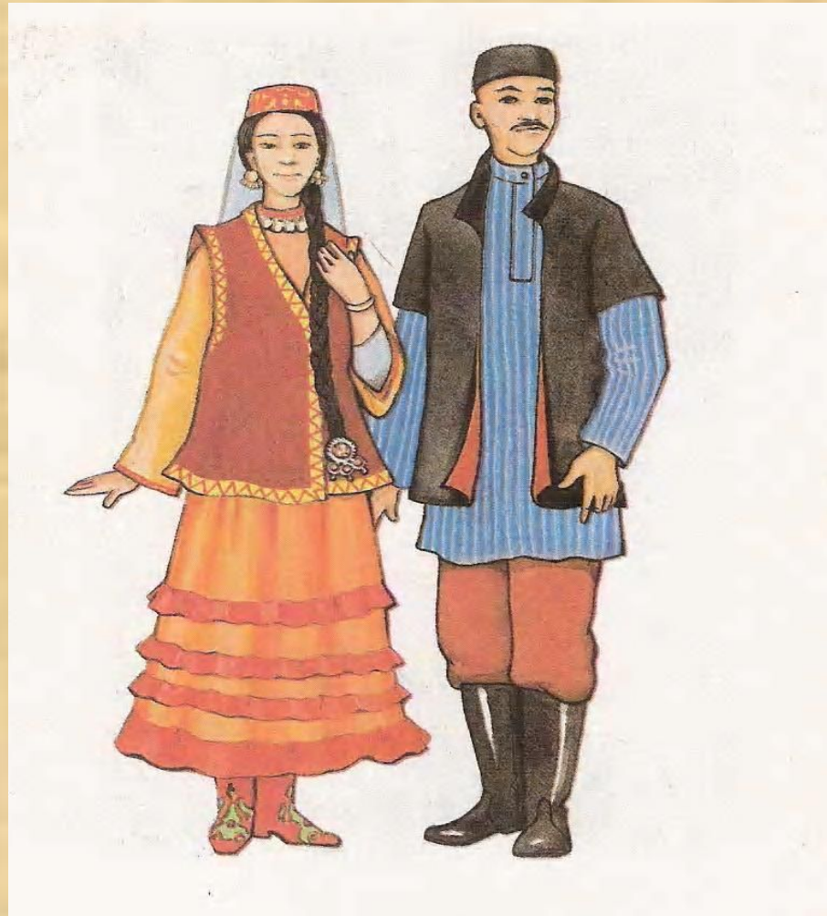
Татарский национальный костюм