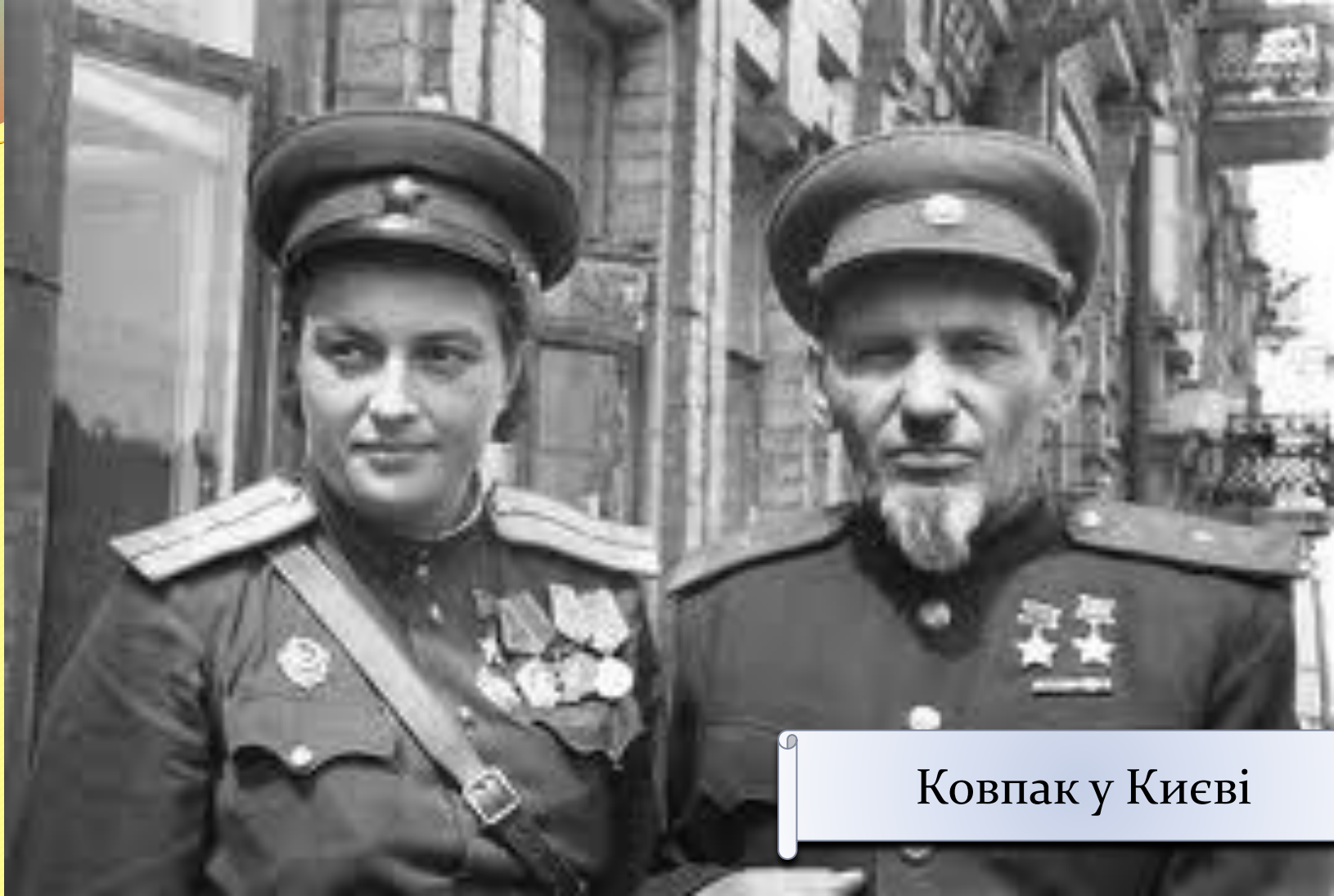
Ковпак у Києві

У лютому 1944 року партизанський загін Сидора Ковпака був перейменований в однойменну першу Українську партизанську дивізію.