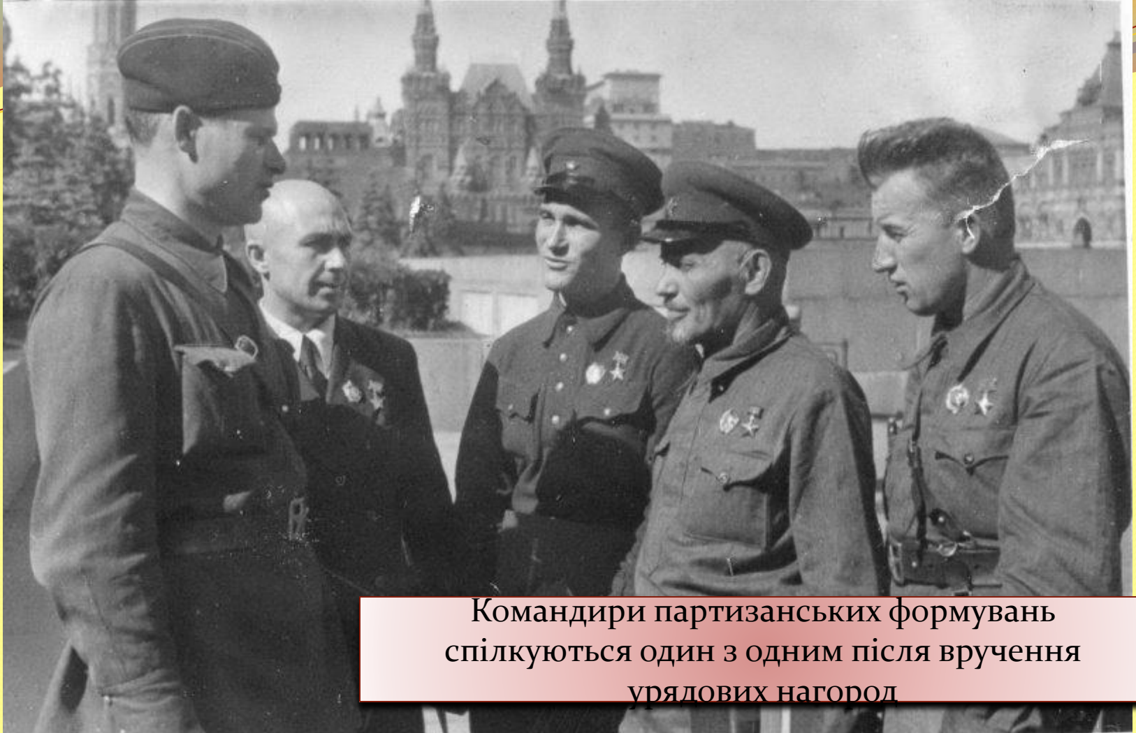
Командири партизанських формувань спілкуються один з одним після вручення урядових нагород

В кінці весни 1942 за зразкове виконання бойових завдань в тилу ворога, проявлений героїзм, Ковпак був удостоєний звання Героя Радянського Союзу, а його соратник Руднев, який відсидів термін перед війною як ворог народу, - орденом «Знак Пошани».