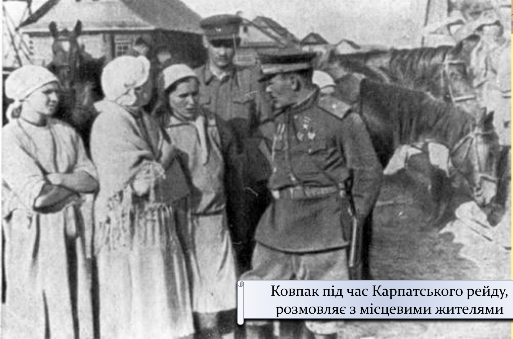
Ковпак під час Карпатського рейду, розмовляє з місцевими жителями

Партизани Ковпака уникали тривалого перебування в рамках якого-небудь визначеного району. Вони робили постійні тривалі маневри у ворожому тилу, піддаючи несподіваним ударам віддалені німецькі гарнізони.