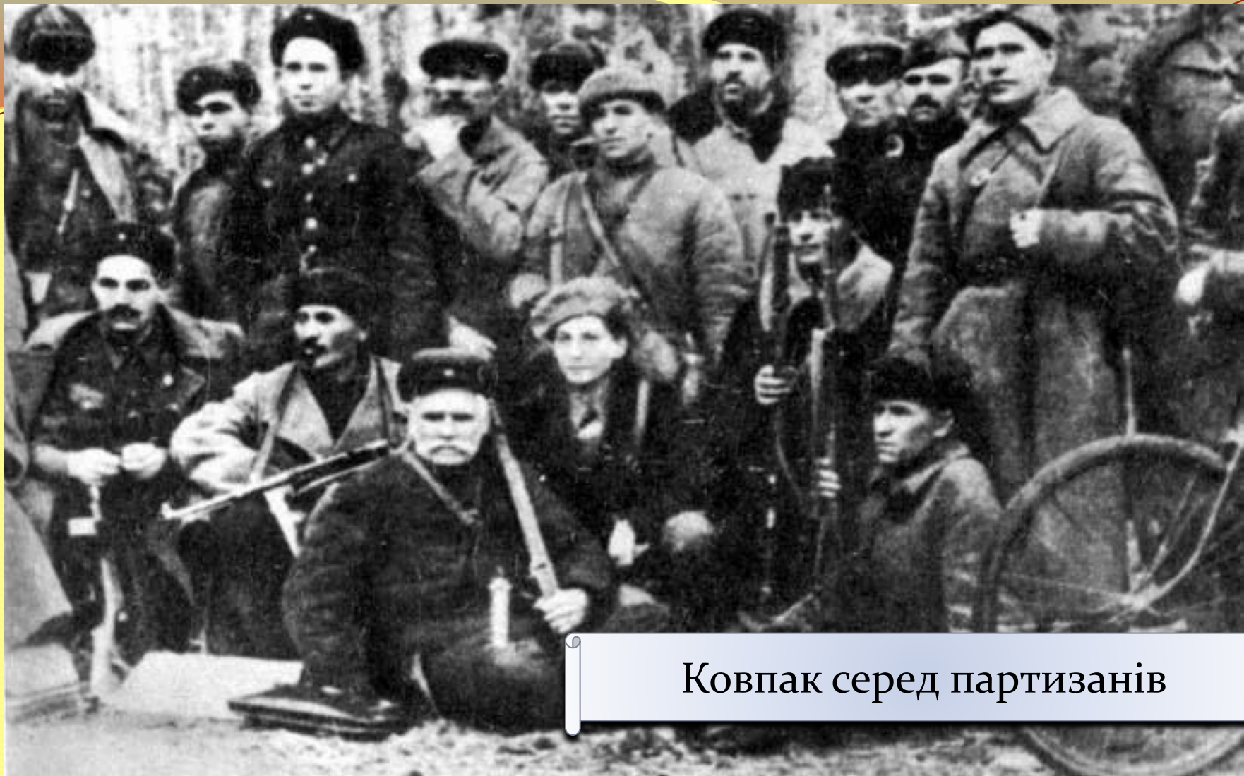
Ковпак серед партизанів

В кінці 1941 року бойовий загін Ковпака здійснив рейд в Хінельські, а навесні 1942 року - в Брянські ліси. Загін поповнився до п'ятисот чоловік і непогано озброївся.