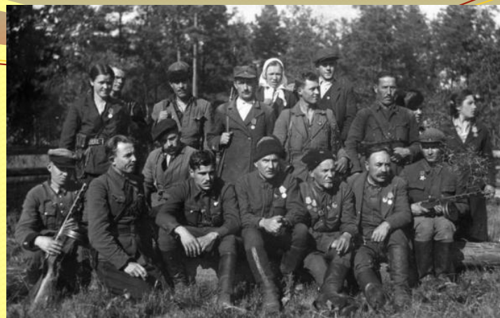
Ковпаківці під час Карпатського рейду

Влітку 1943 року його з'єднання починає Карпатський рейд . З'єднання пройшло більше 10 000 кілометрів, борючись з бандерівцями, регулярними німецькими частинами і елітними військами СС генерала Крюгера. В результаті операції була на довгий час затримана доставка бойової техніки і військ противника в район Курської дуги. Через кілька тижнів у Житомирських лісах вони знову з'єдналися в один грізний загін.