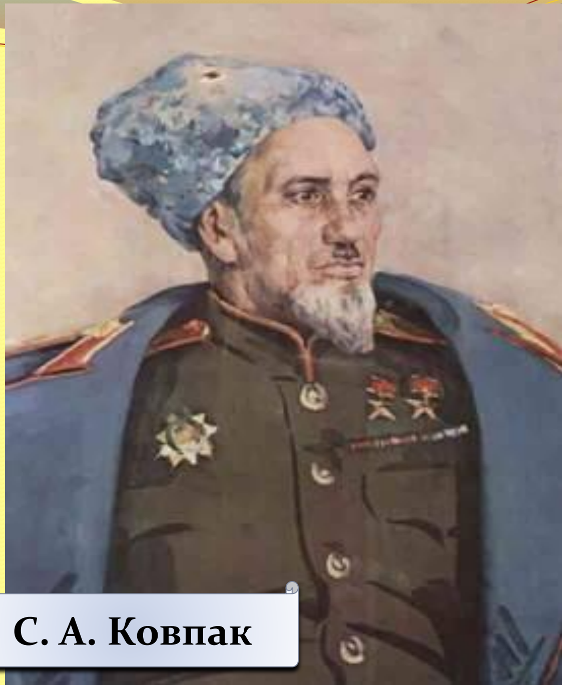
С. А. Ковпак

Ковпак Сидір Артемович — керівник радянських партизанських загонів в Україні, генерал-майор, двічі Герой Радянського Союзу (1942, 1944).