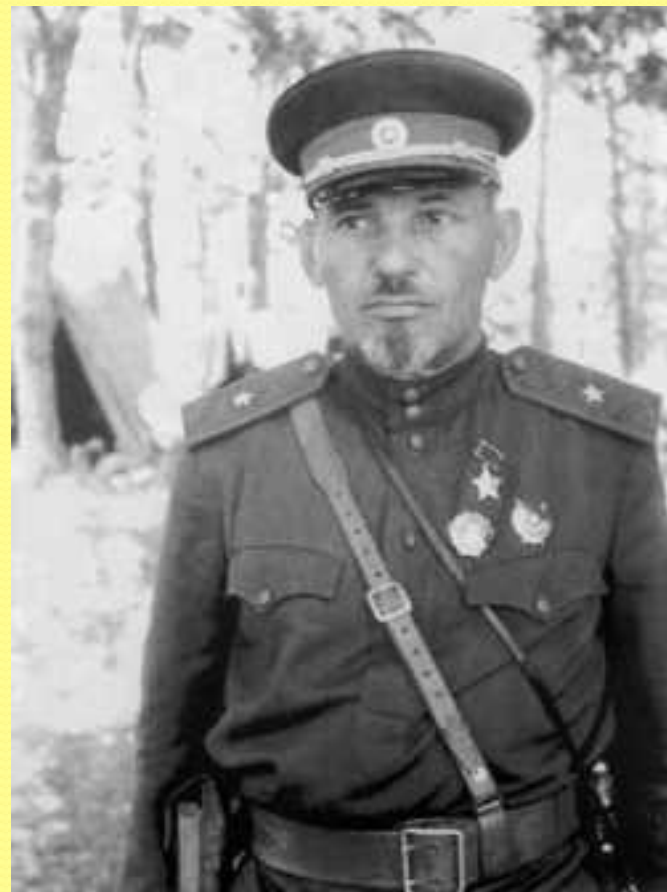
С. А. Ковпак