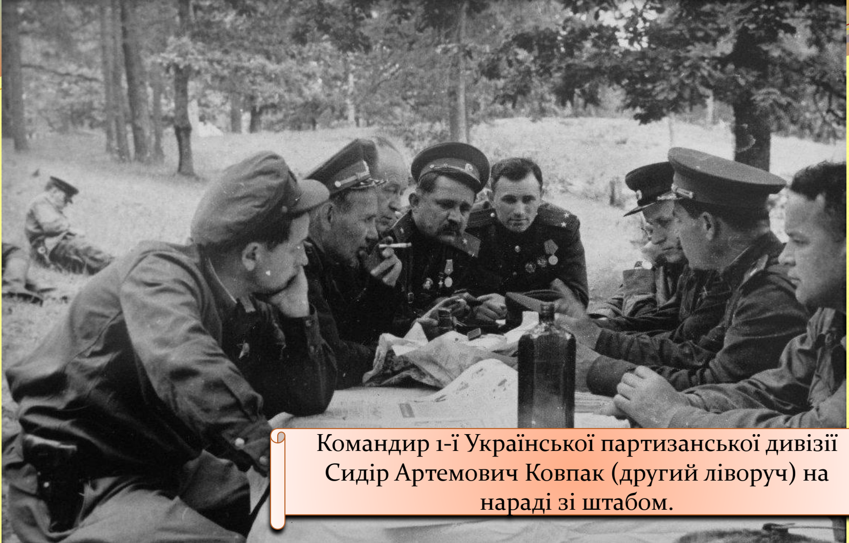
Командир 1-ї Української партизанської дивізії Сидір Артемович Ковпак (другий ліворуч) на нараді зі штабом.

Так народжувалася знаменита рейдова тактика партизанської боротьби, у якій без праці угадувалися традиції і прийоми революційної війни 1918-21 років - прийоми, відроджені і розвинуті командиром Ковпаком.