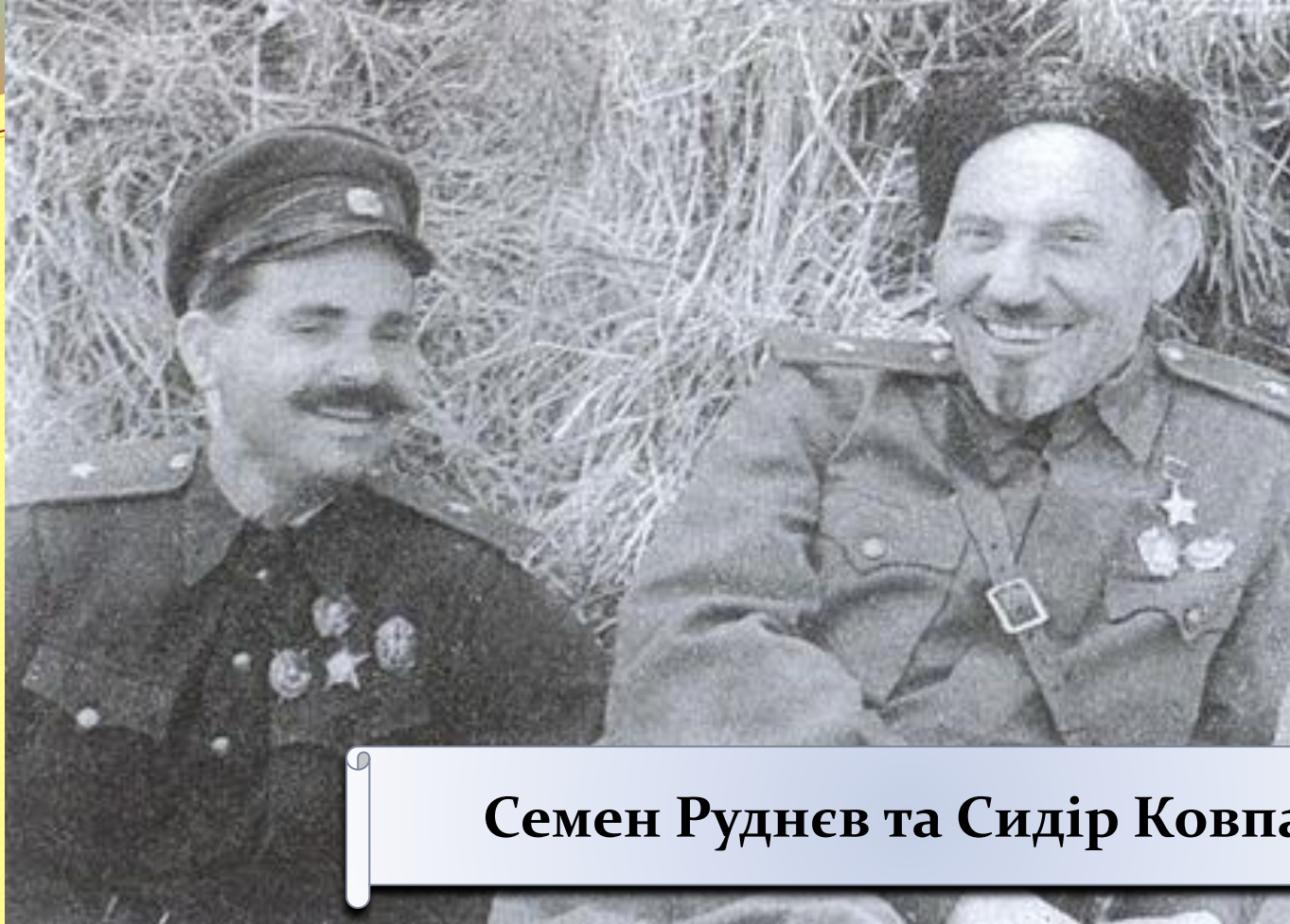
Семен Руднев та Сидір Ковпак

Під час Карпатського рейду Семен Руднев був убитий, а Сидір Артемович важко поранений в ногу. В кінці 1943 року він відбув до Києва на лікування і більше не воював. За успішне проведення операції 4 січня 1944 генерал-майор Ковпак отримав вдруге звання Героя Радянського Союзу.