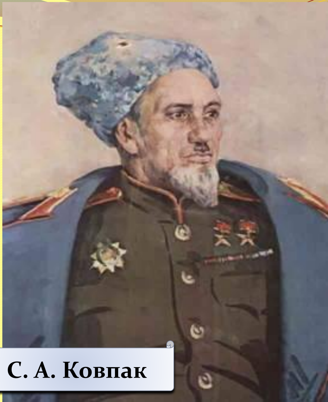
С. А. Ковпак

Ковпак Сидір Артемович — керівник радянських партизанських загонів в Україні, генерал-майор, двічі Герой Радянського Союзу (1942, 1944).