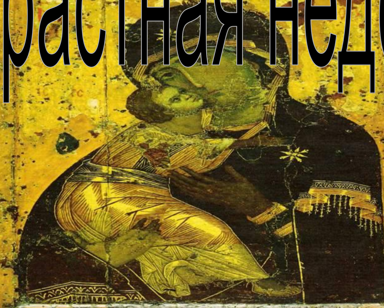
Владимирская Богоматерь. Начало XII в.