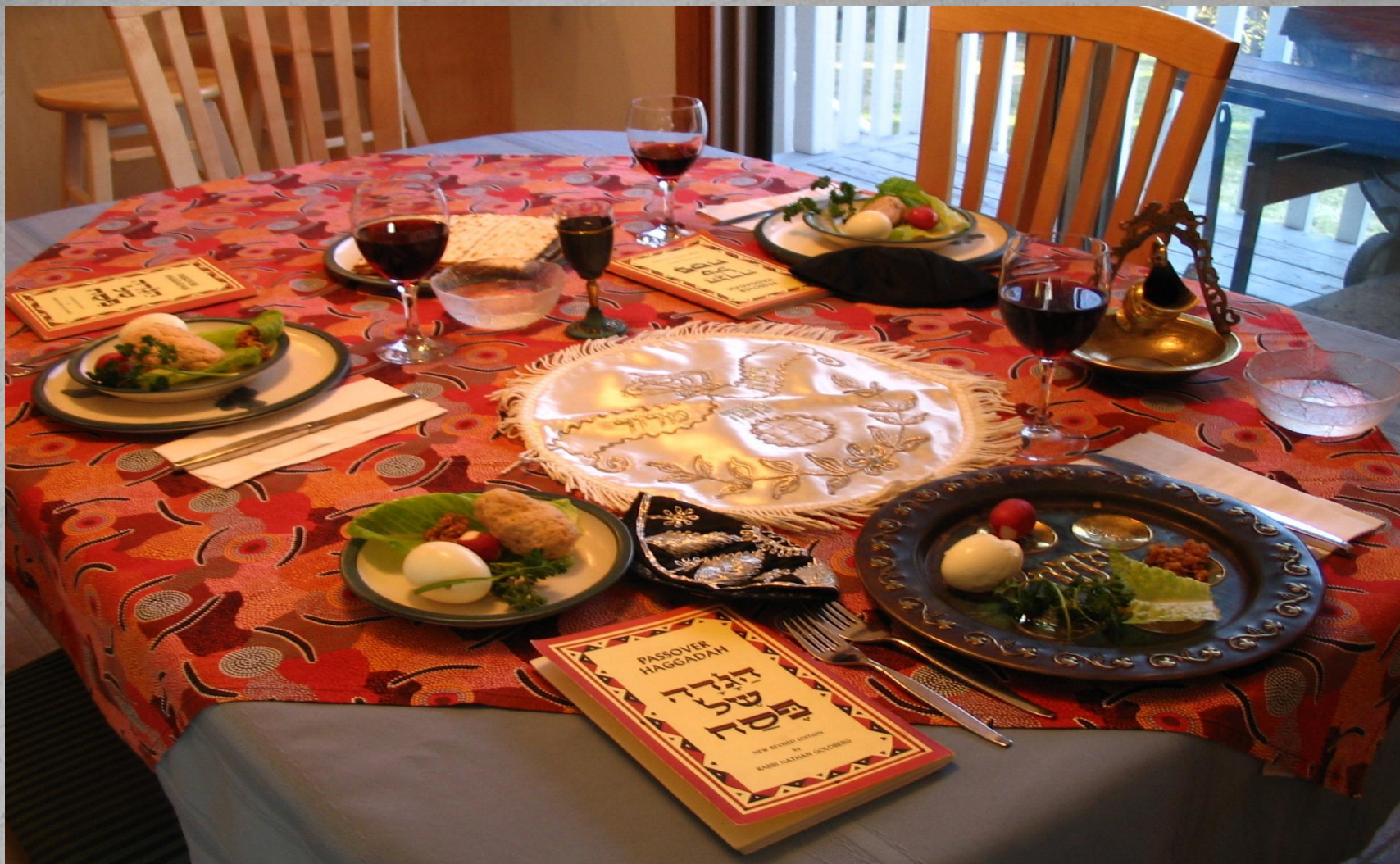
Один из видов украшения стола к встрече Песаха