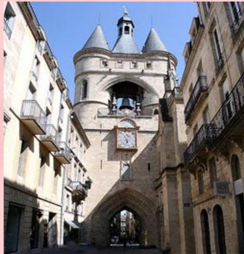
Большая колокольня Бордо, Франция.