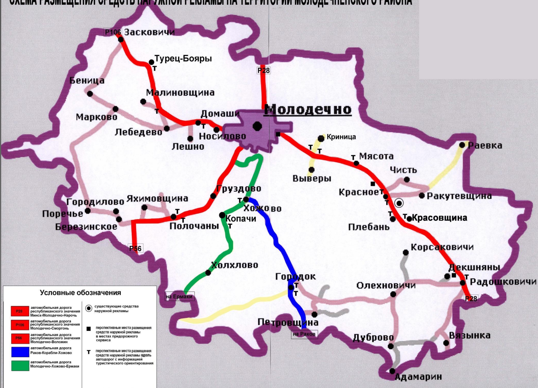
СХЕМА РАЗМЕЩЕНИЯ СРЕДСТВ НАРУЖНОЙ РЕКЛАМЫ НА ТЕРРИТОРИИ МОЛОДЕЧНЕНСКОГО РАЙОНА