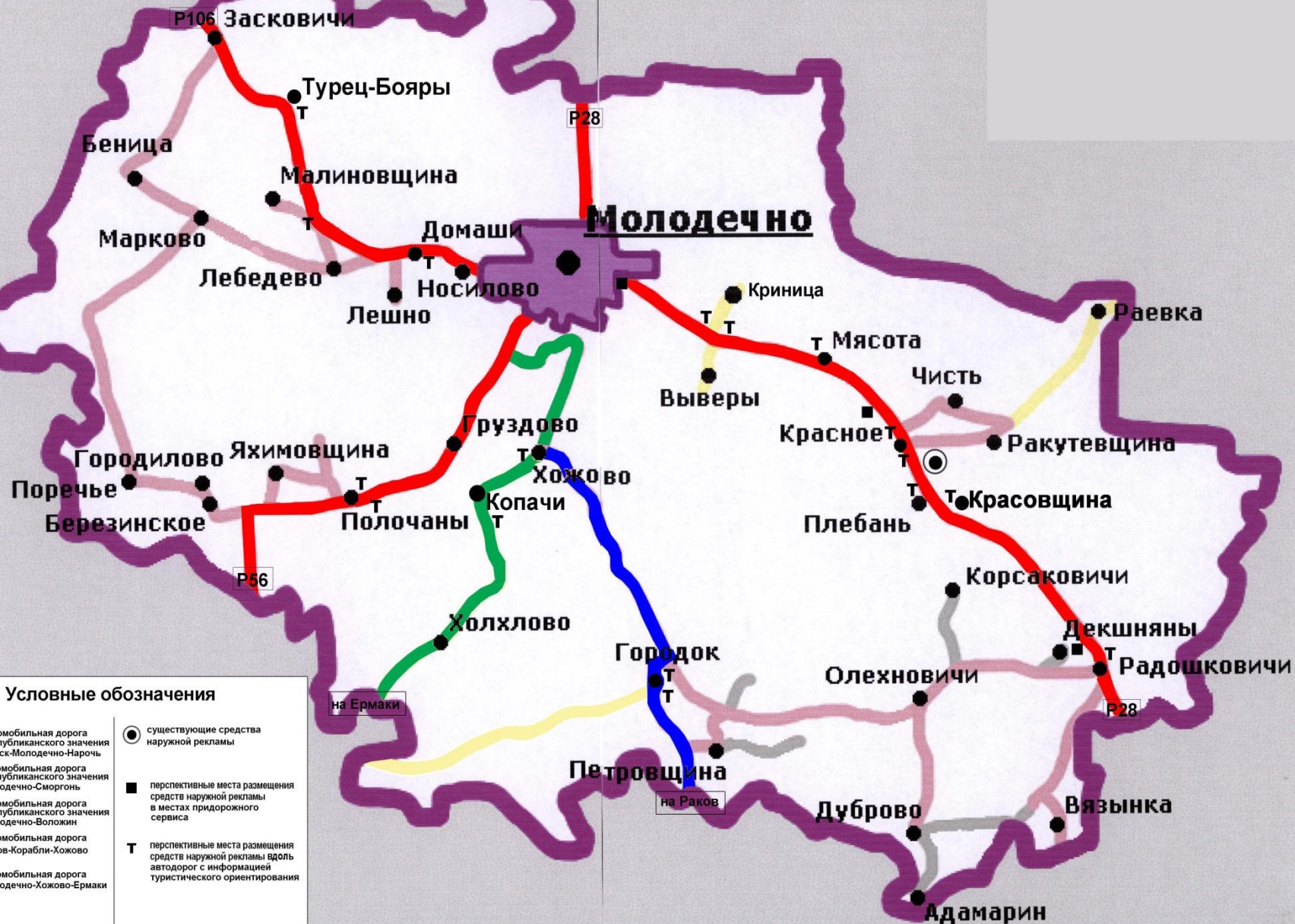
СХЕМА РАЗМЕЩЕНИЯ СРЕДСТВ НАРУЖНОЙ РЕКЛАМЫ НА ТЕРРИТОРИИ МОЛОДЕЧНЕНСКОГО РАЙОНА