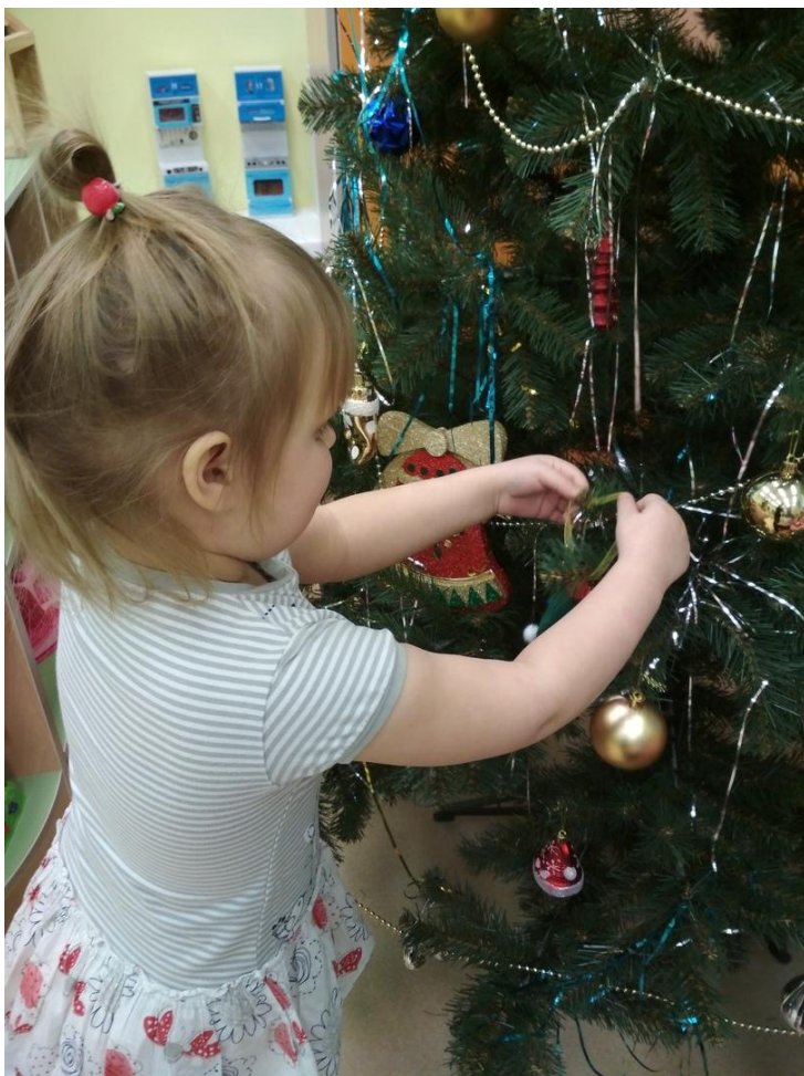
Реально-практическая ситуация «Мы наряжаем ёлку»