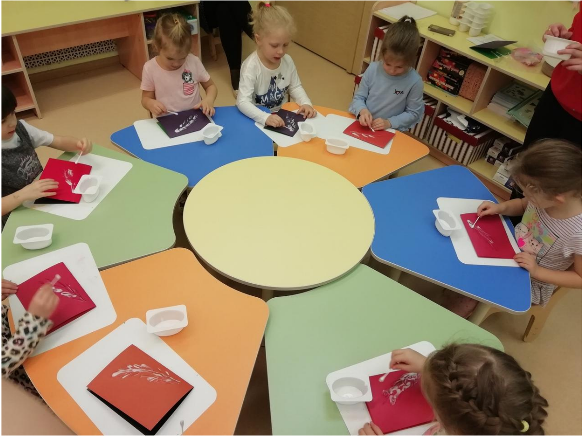
Мастер-класс «Как изготовить новогоднюю открытку?»