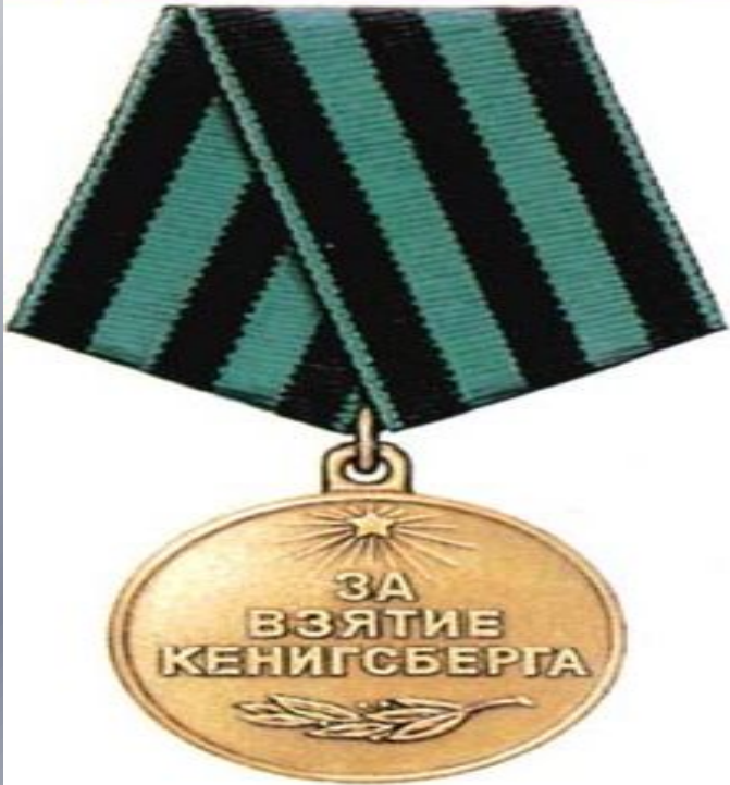
МЕДАЛЬ «ЗА ВЗЯТИЕ КЕНИГСБЕРГА»