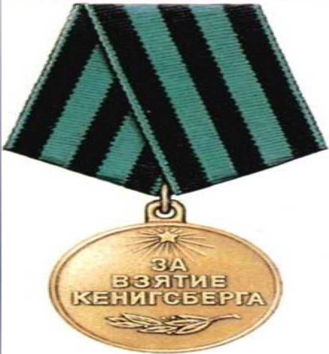
МЕДАЛЬ «ЗА ВЗЯТИЕ КЕНИГСБЕРГА»