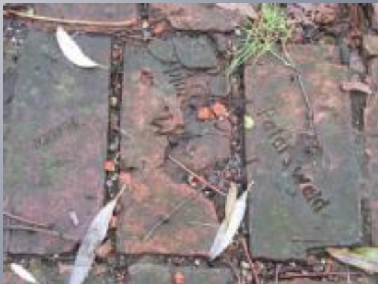
Кирпичи у Фридланских ворот