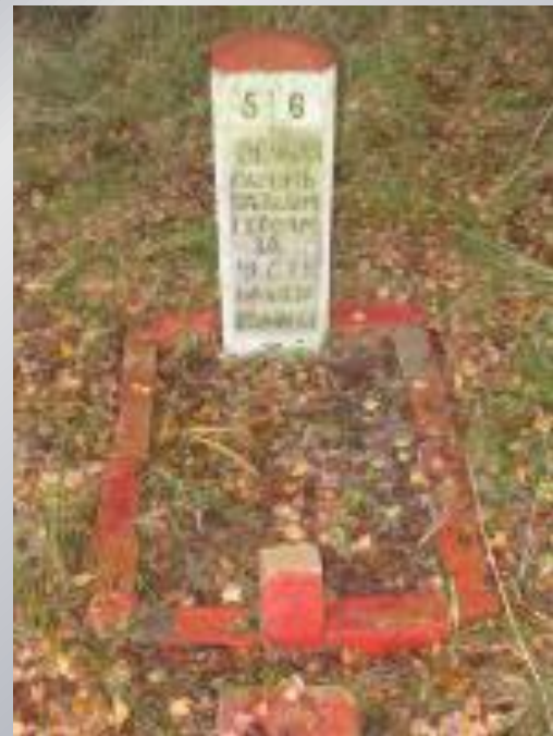
Самое западное захоронение советских воинов на территории РФ. Балтийская коса