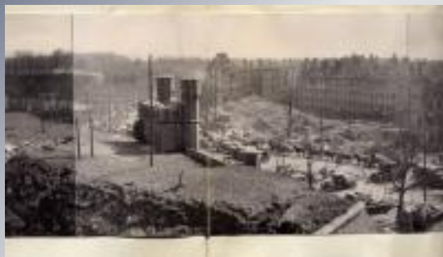
Панорама с башни Dohna