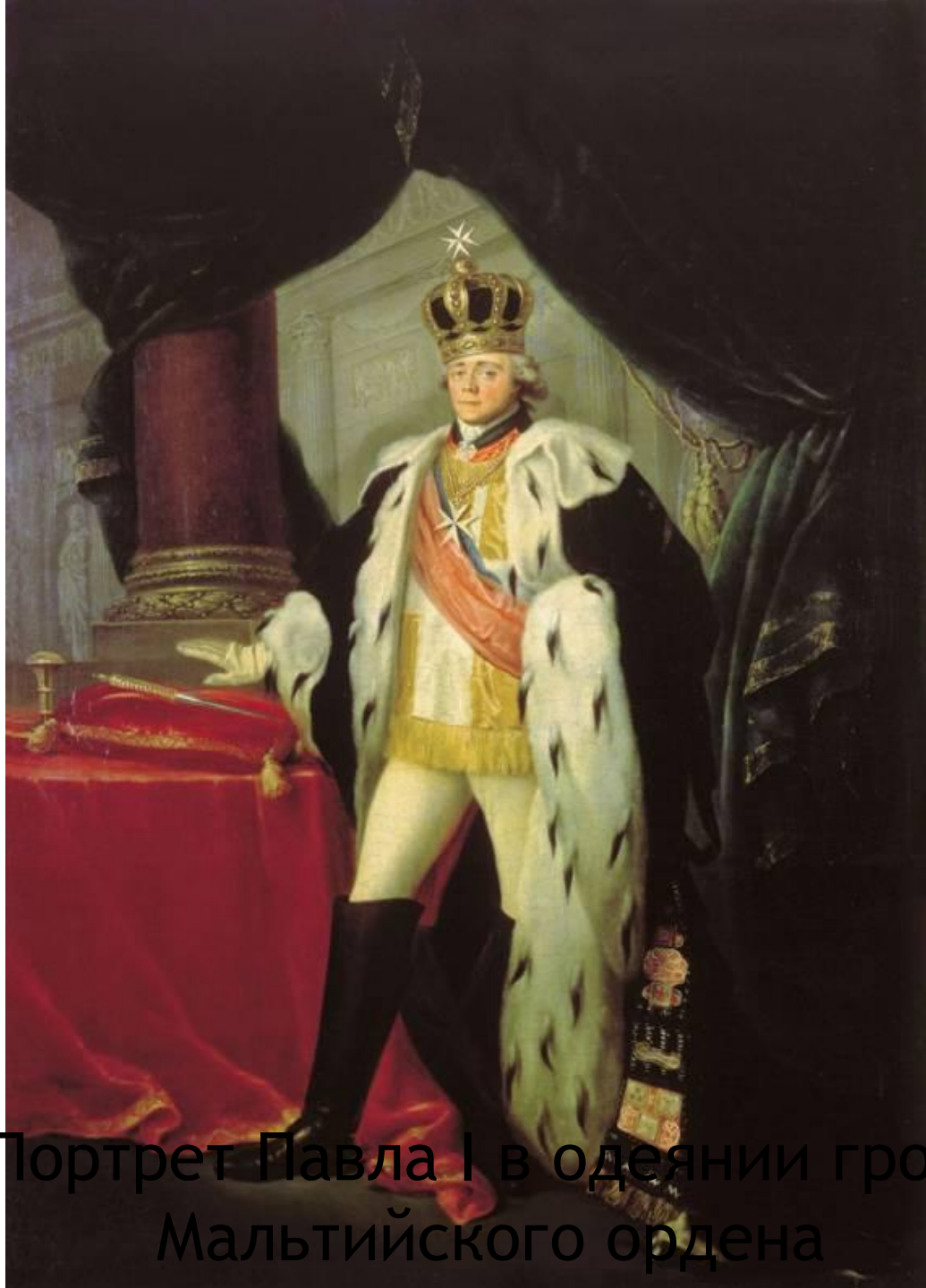
С. Тончи : Портрет Павла I в одеянии гроссмейстера Мальтийского ордена