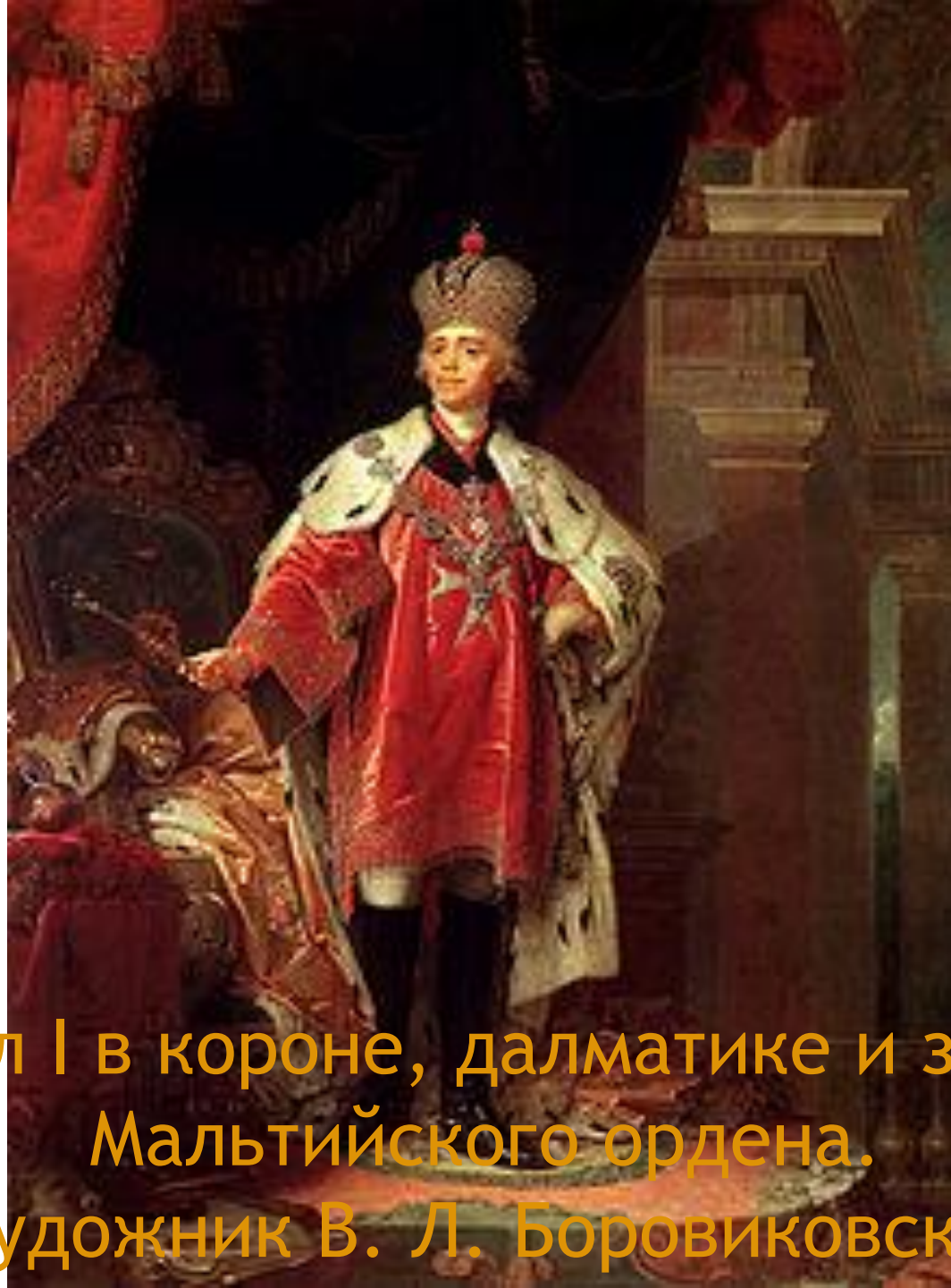
Павел I в короне, далматике и знаках Мальтийского ордена. Художник В. Л. Боровиковский