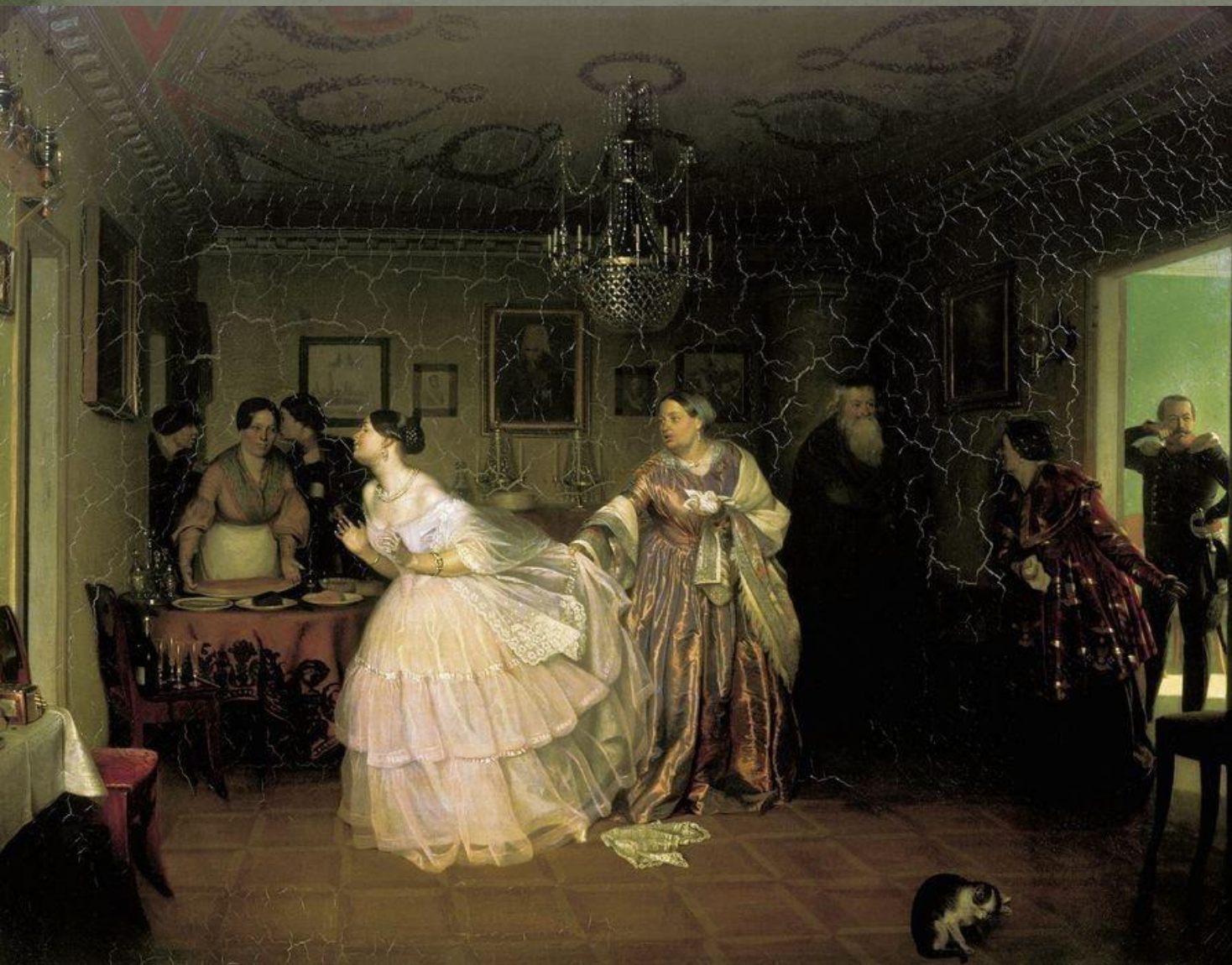
«Сватовство майора (Смотрины в купеческом доме)»