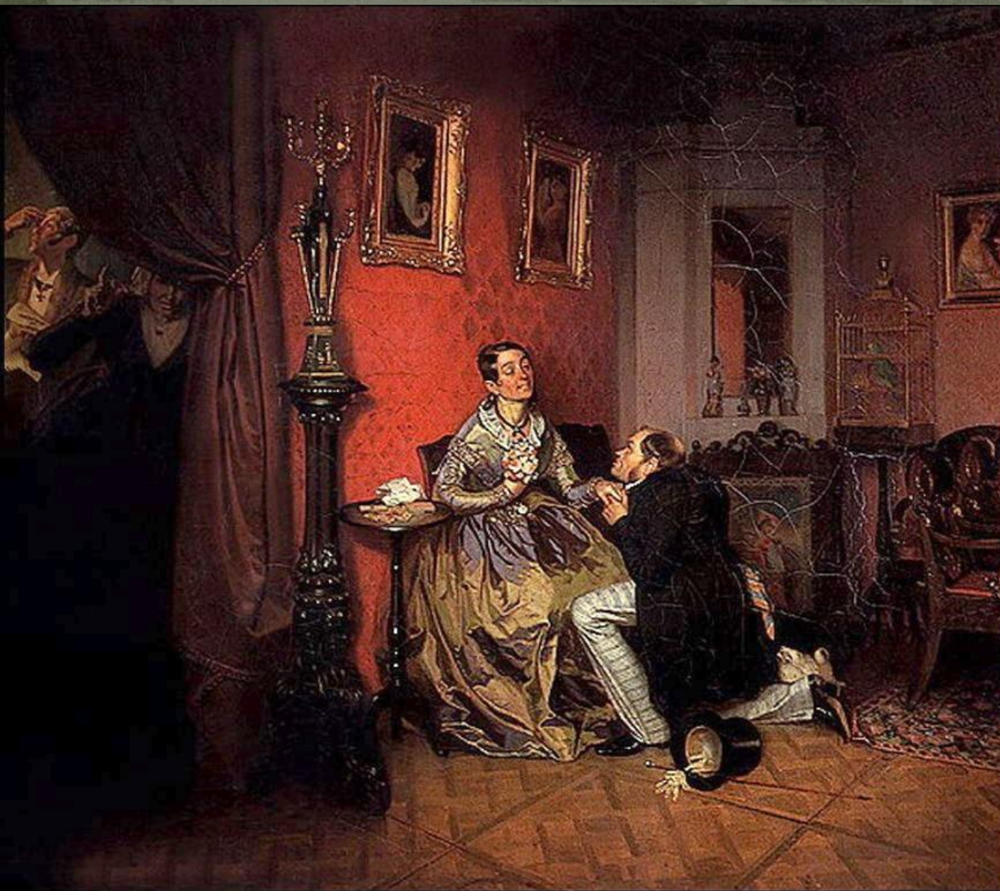
Разборчивая невеста 1847г.