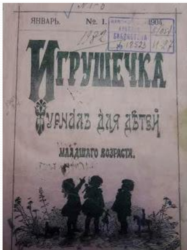
"Игрушечка" Журнал для детей младшего возраста, № 1, Январь 1904 год ( издавался в 1880-1912 гг. )