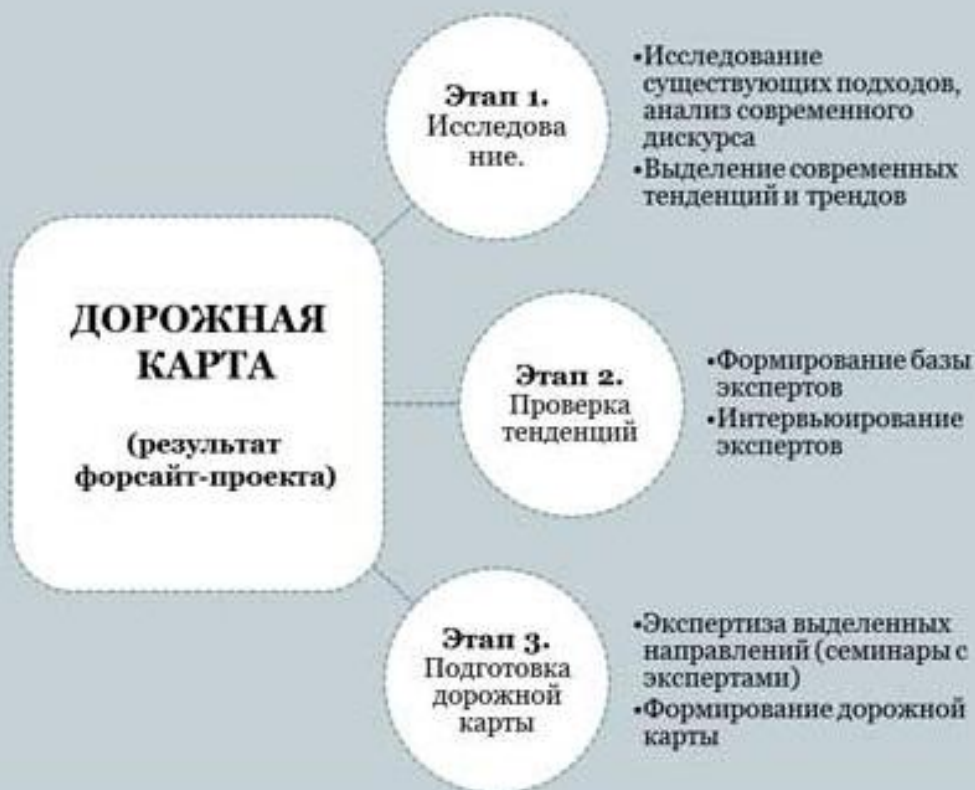
Схема исследования будущего

«Будущее нельзя предвидеть, но можно изобрести»