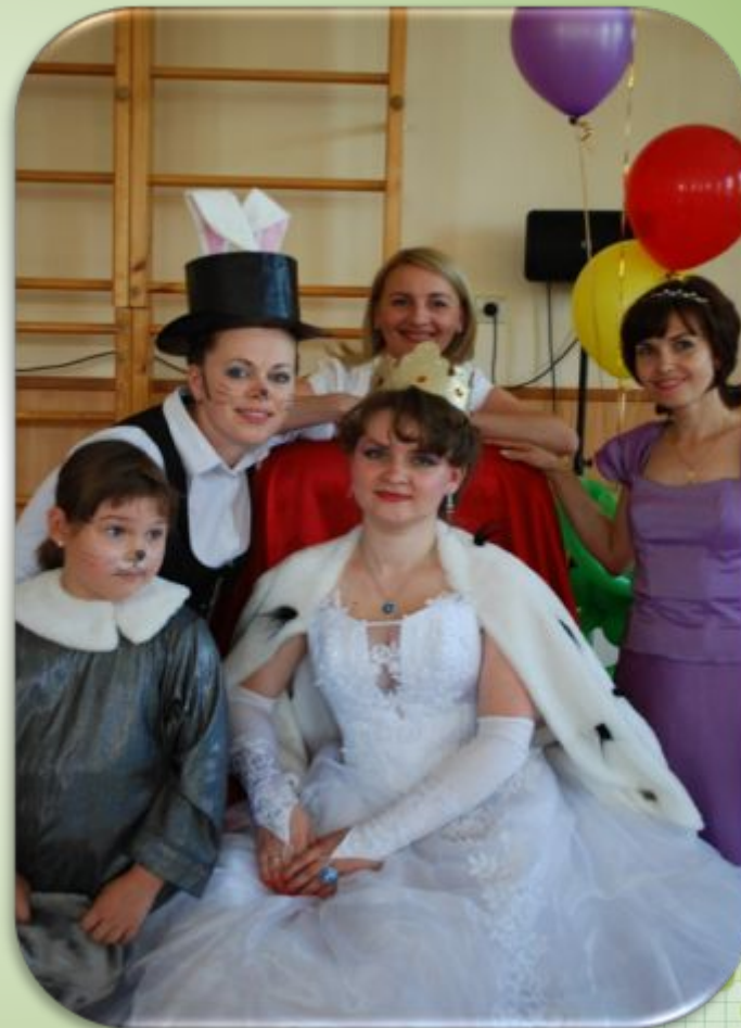
Выпускной бал «Алиса в стране чудес»