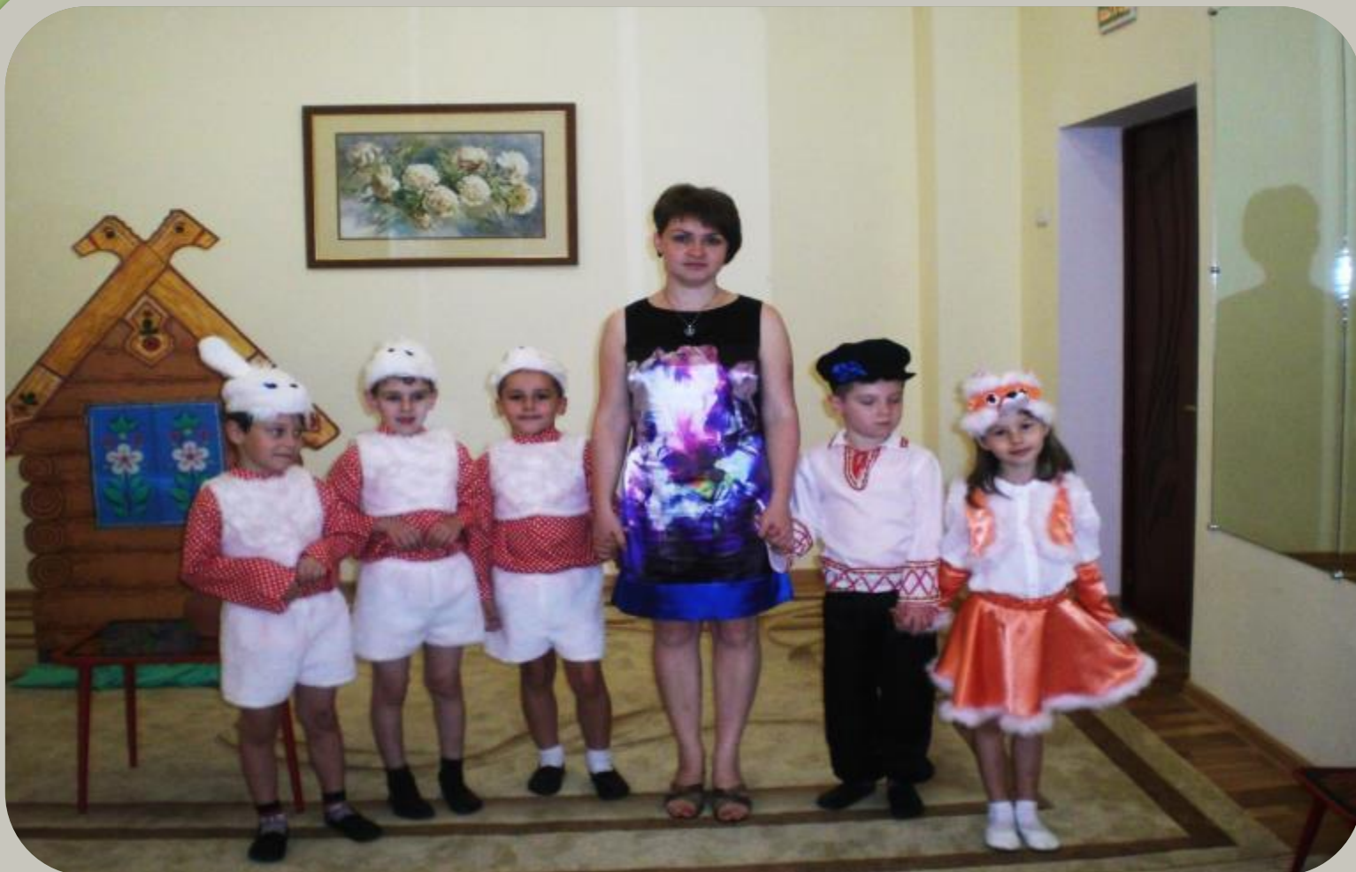
Игра-драматизация «Лиса и Журавль»