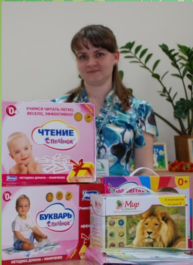
Развитие интеллекта с пеленок по методикам Домана-Маниченко