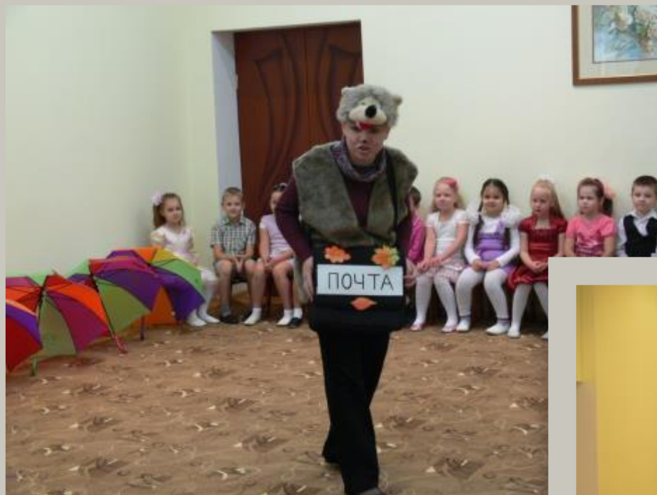
Утренник «Шляпный бал»