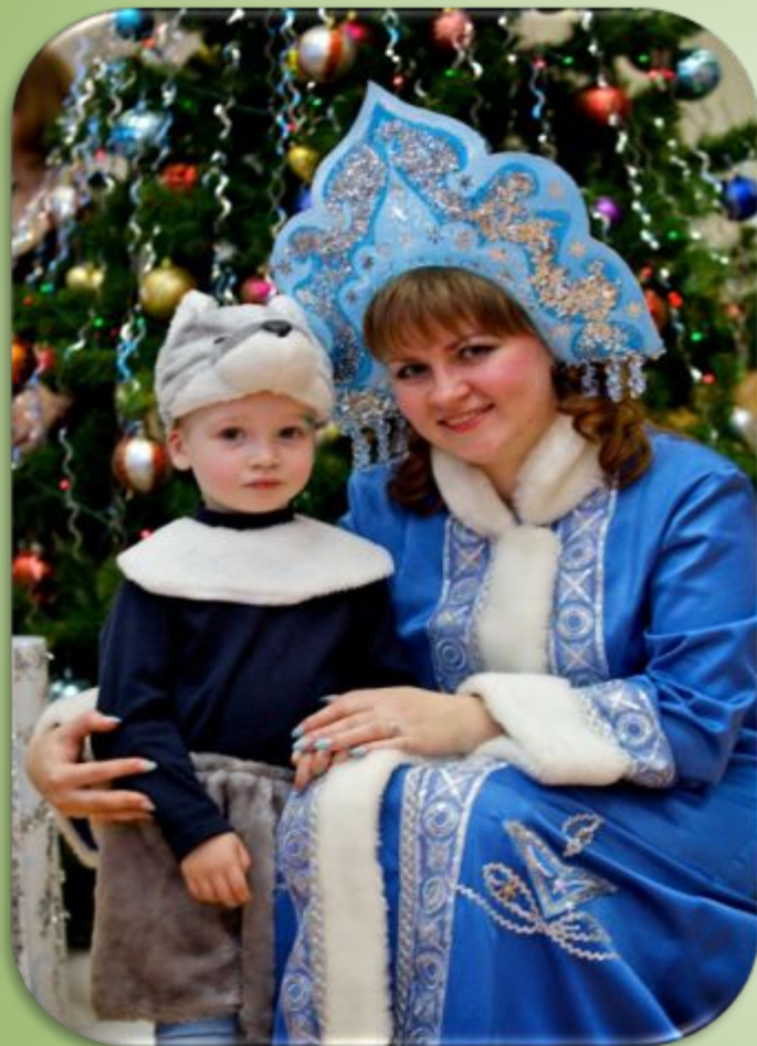
Утренник «В гостях у Снегурочки»