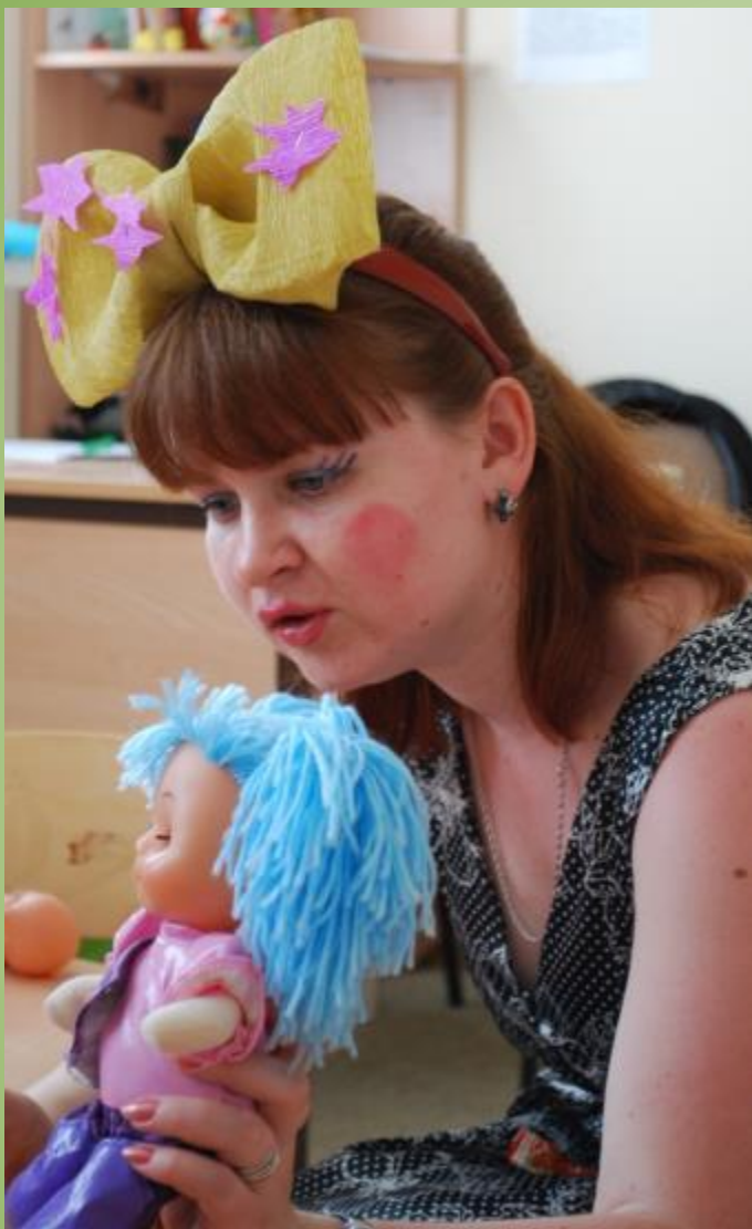
Занятия в группе «МалышОК», посвященные Дню защиты детей