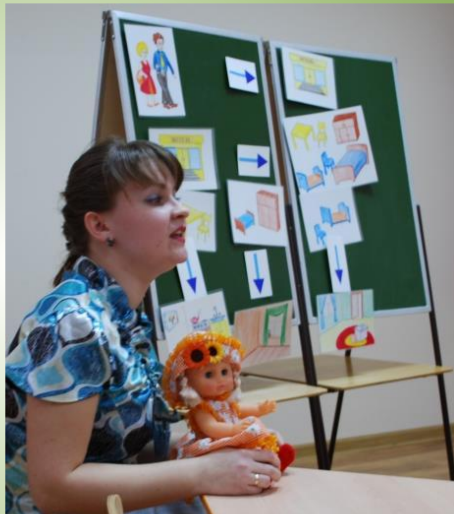
Конспект НОД по развитию речи «Как мама и папа покупали мебель»