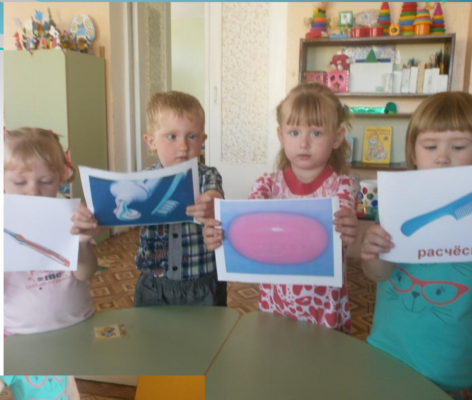
Ди «Подбери картинку»