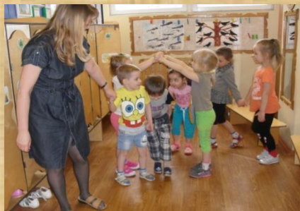
в раздевалке перед занятием «Золотые ворота», «Игра с козликком»