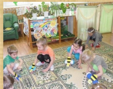
Физ. минутка во время занятий «Пчёлы и ласточка»