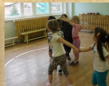
«Игра с солнцем»