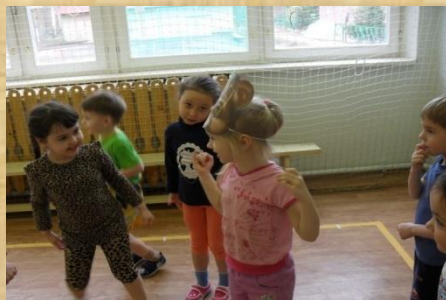
во время проведения физкультурного, музыкального занятий «Мы в густом лесу гуляли...»