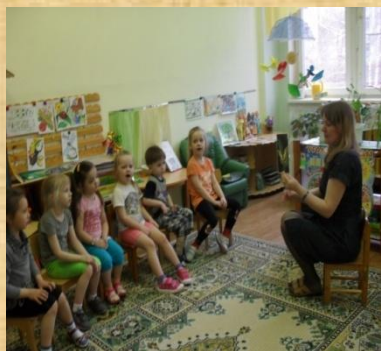
с рассмотрением картинок