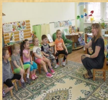
с показом игрушки