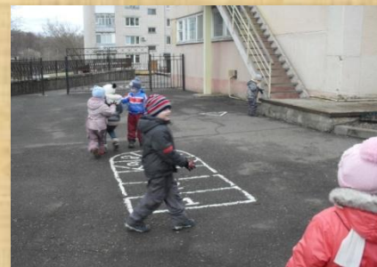
во время прогулки «Ловишки с платочком»