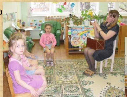
с использованием приёма «присутствия игрового персонажа»