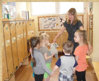
«Игра с козликом»