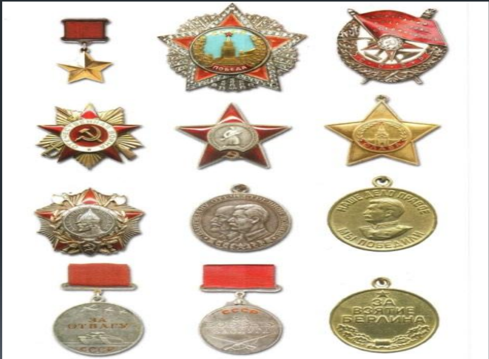
«Ордена и медали»