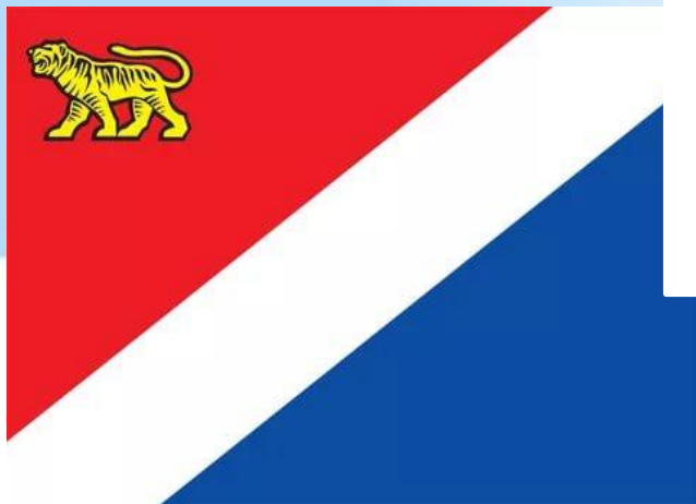
Флаг Приморского края