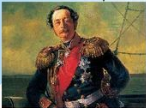
Генерал-губернатор Восточной Сибири Н. Н. Муравьев - Амурский