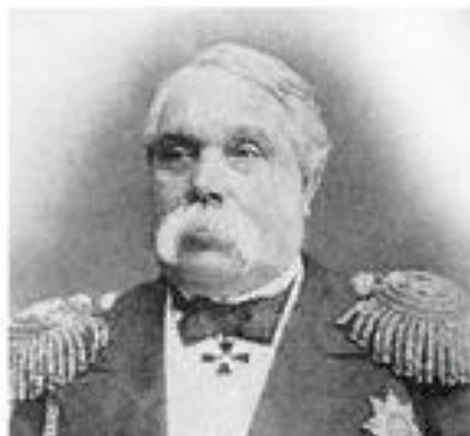
Петр Васильевич Казакевич – первый военный губернатор Сибирской Флотилии